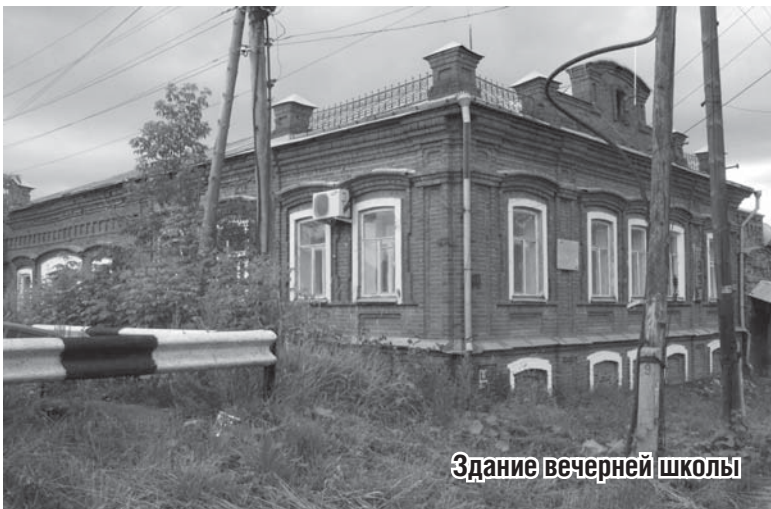
Здание вечерней школы