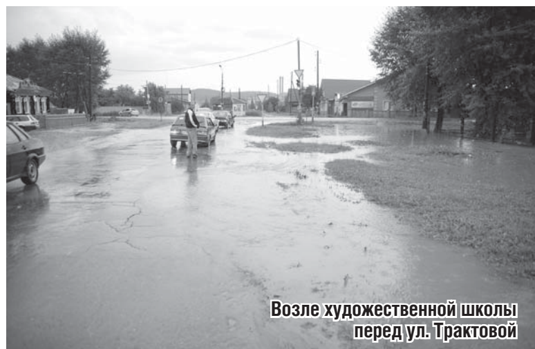
Возле художественной школы перед ул. Тракторной

Всех, кто располагает какой-либо информацией о местонахождении мальчика, просим обращаться в полицию по телефонам: 8(34374) 7-14-71, или по линии 02.