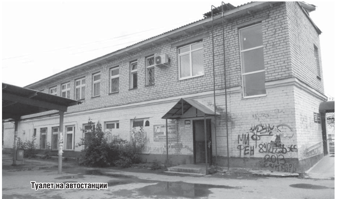
Туалет на автостанции

С вопросом о том, нужна ли городу сеть общественных уборных, мы обратились к первому заместителю