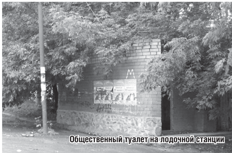
Общественный туалет на лодочной станции