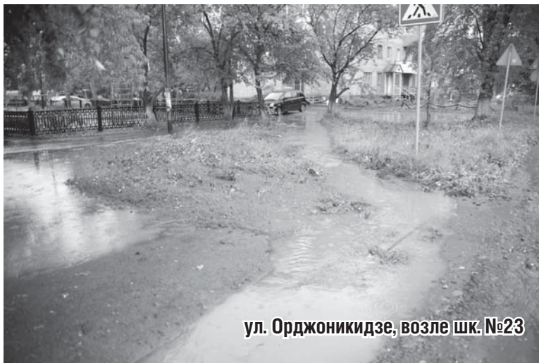
ул. Орджоникидзе, возле шк. №23

Еще одно происшествие случилось на лодочной станции – от