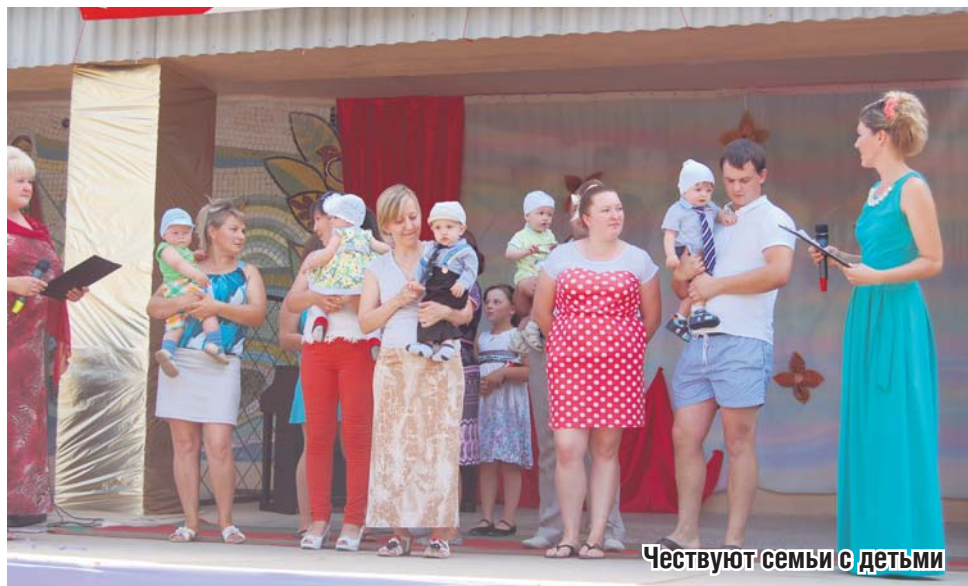
Чествуют семьи с детьми

хочу поступить в УГГУ и стать профессиональным геологом.