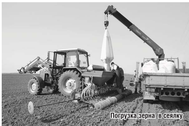
Погрузка зерна в сеялку