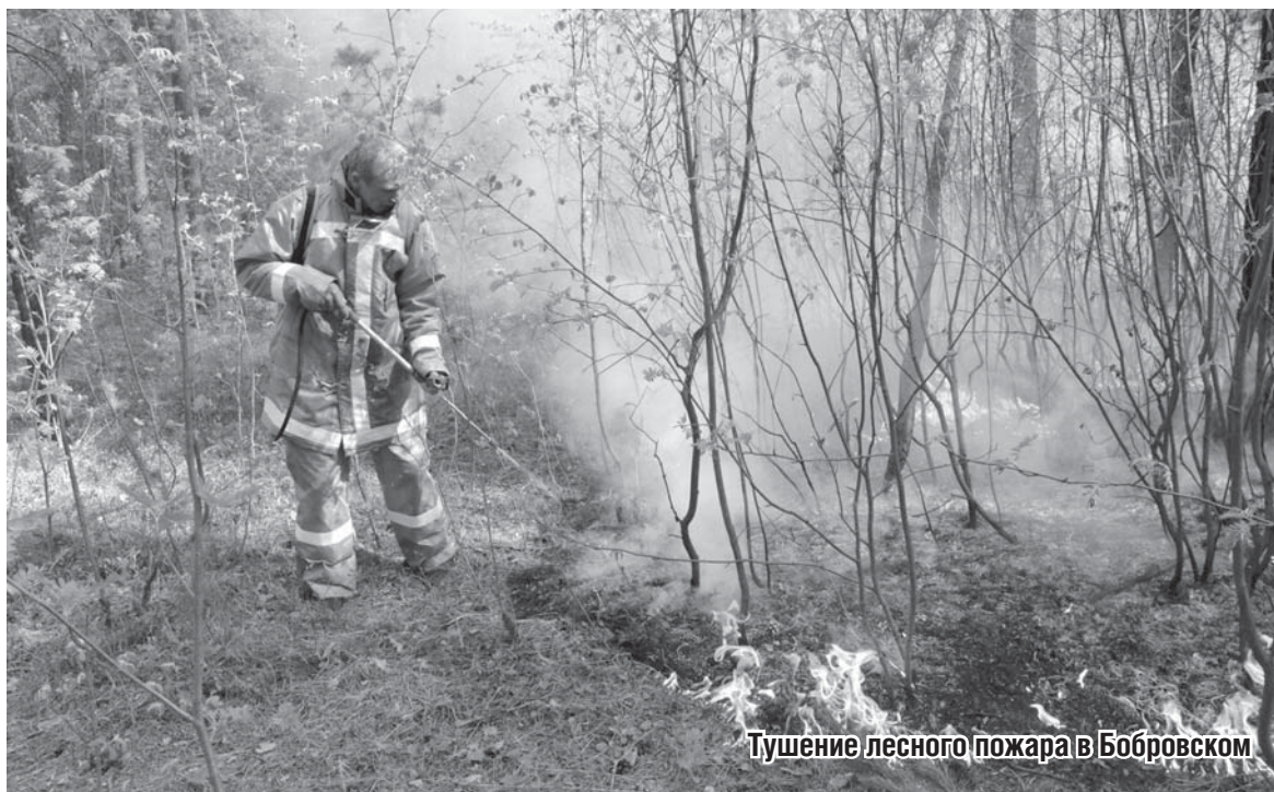
Тушение лесного пожара в Бобровском