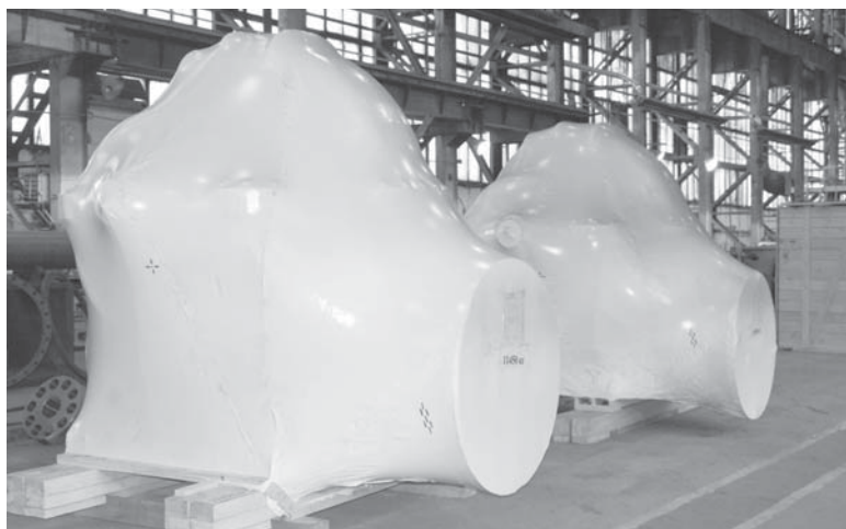
Насосы для Крыма

Сроки были поставлены жесткие, – говорит начальник конструкторского бюро насосов Дмитрий Пугач. – На руку нам сыграло то, что разработку твердотельных моделей корпусных деталей