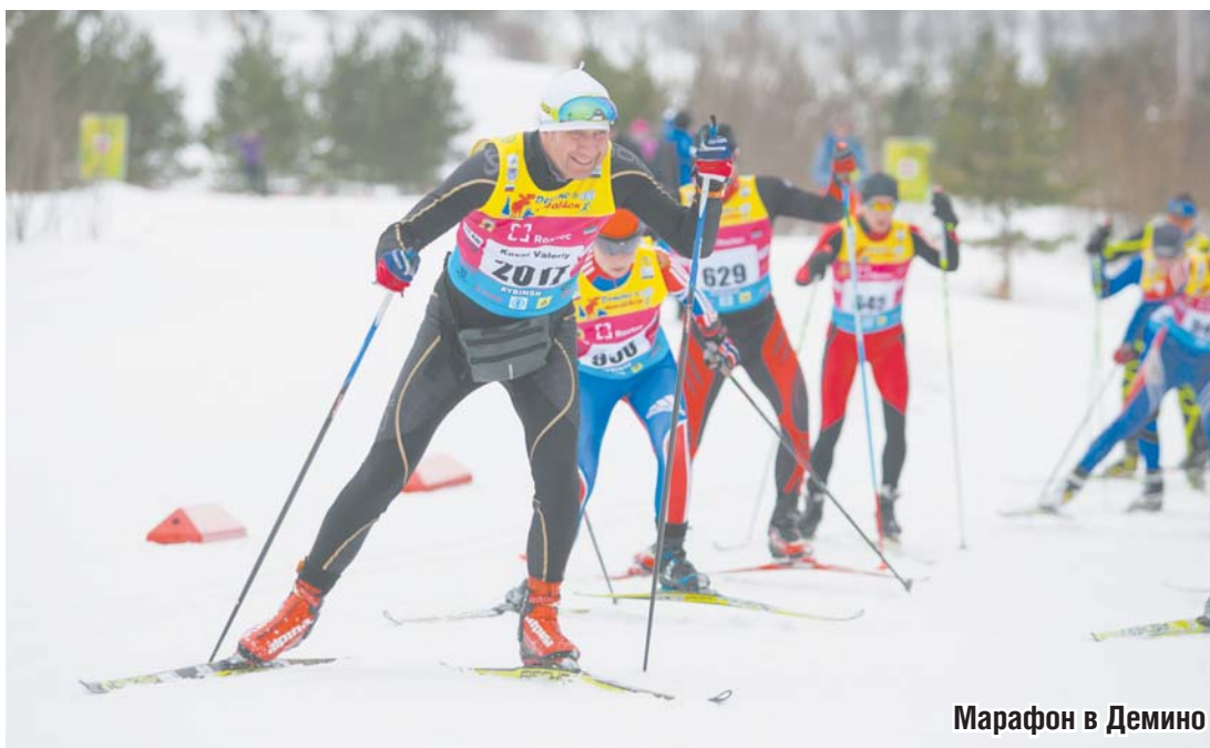
Марафон в Демино