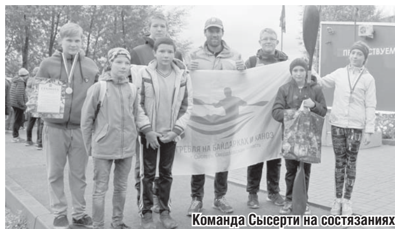
Команда Сысерти на состязаниях

Воспитанники сысертской ДЮСШ по лыжному спорту в прошедшие выходные вернулись с чемпионата и первенства Челябинской области и чемпионата Урала по гребле на байдарках и каноэ. На состязаниях выступили более трехсот участников из пяти регионов РФ: Свердловской,