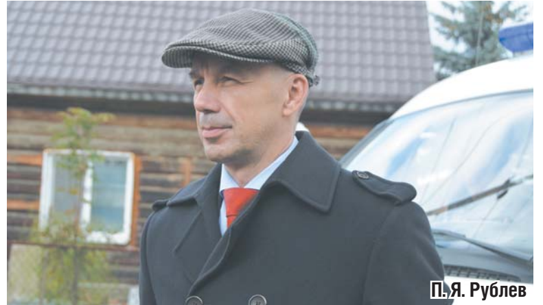
П. Я. Рублев

Поселок Школьный – точка перспективного развития Сысерти. Здесь, согласно генеральному плану, планируется активная застройка. У новостроек также будет