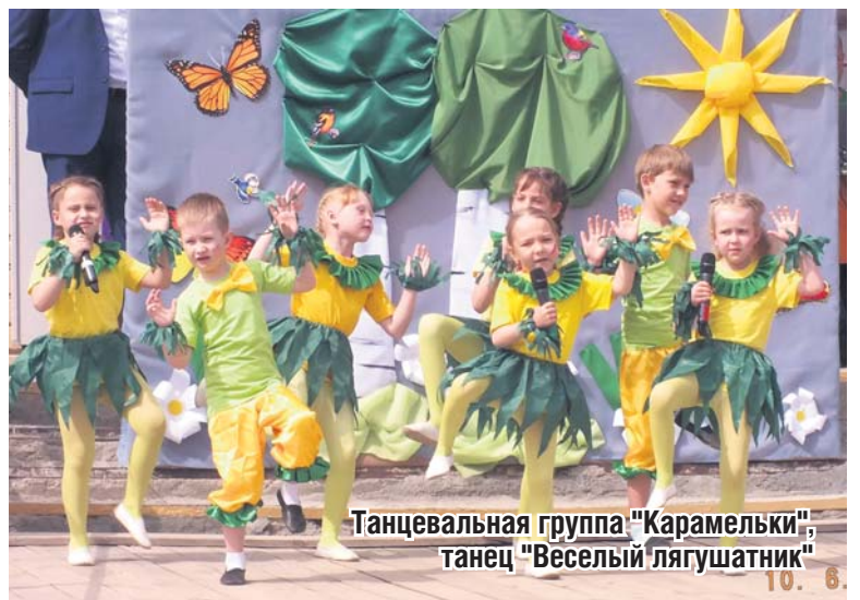
Танцевальная группа «Карамельки», танец «Веселый лягушатник»