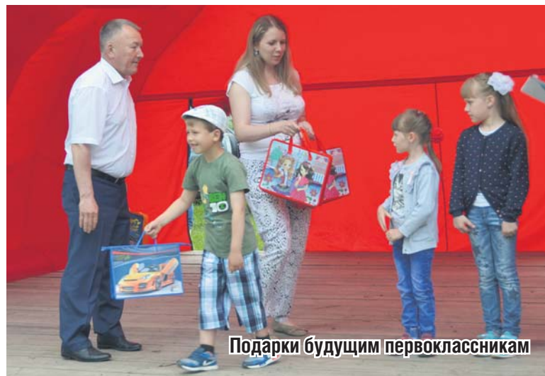
Подарки будущим первоклассникам