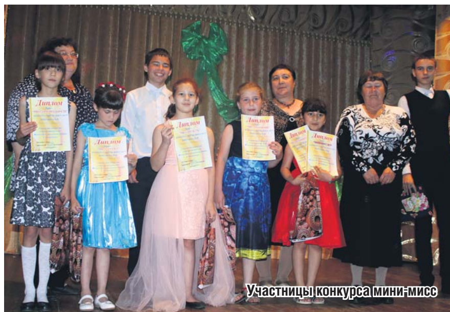
Участницы конкурса «мини-мисс»