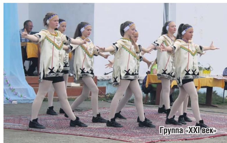
Группа «XXI век»

тепло приветствовали артистов из Щелкуна - группу «XXI век» и творческий коллектив из дома культуры Верхней Боевки.