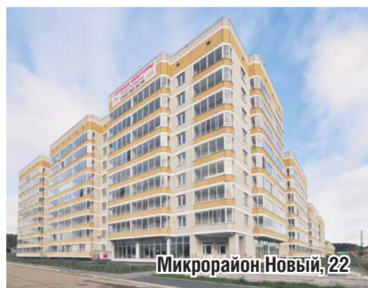
Микрорайон Новый, 22

2017 года в жилом доме по ул. Свободы 38а осталось всего 15 квартир, в доме по адресу мкрн. Новый, 22 в продаже 35 квартир.