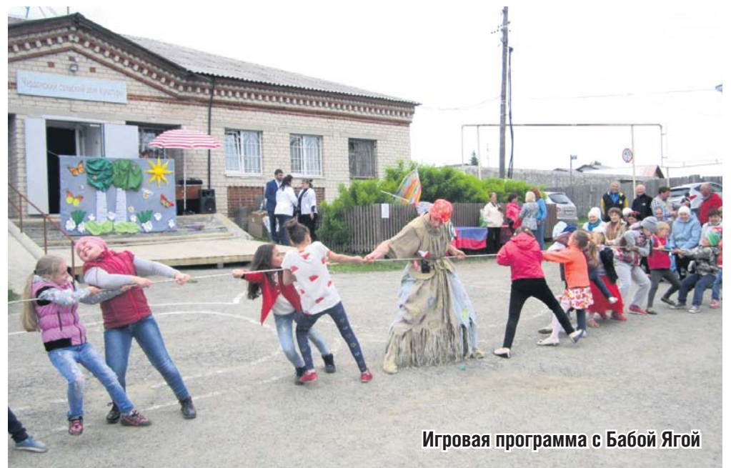
Игровая программа с Бабой Ягой