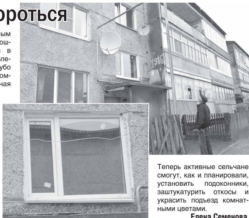
принесли извинения жителям дома, устранили недочеты.

Хорошо, что сысертская компания вовремя вспомнила о совести и своих обязательствах перед клиентами. Через день после нашего визита в Никольское приехала бригада фирмы, они