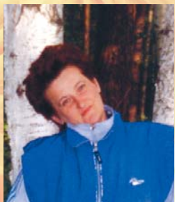
С любовью, твои друзья.

поздравляем с юбилеем и выходом на пенсию. Здоровья тебе родная! Будь всегда красивой и жизнерадостной.