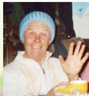
Дети, внуки, правнуки.

Первое число – День рождения мамы! С Днем рождения тебя, Мама милая моя, Пусть тебя твой добрый Ангел хранит!