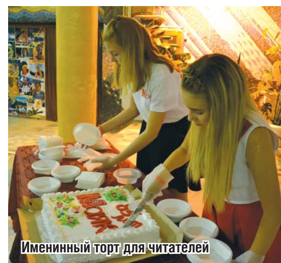
Именинный торт для читателей