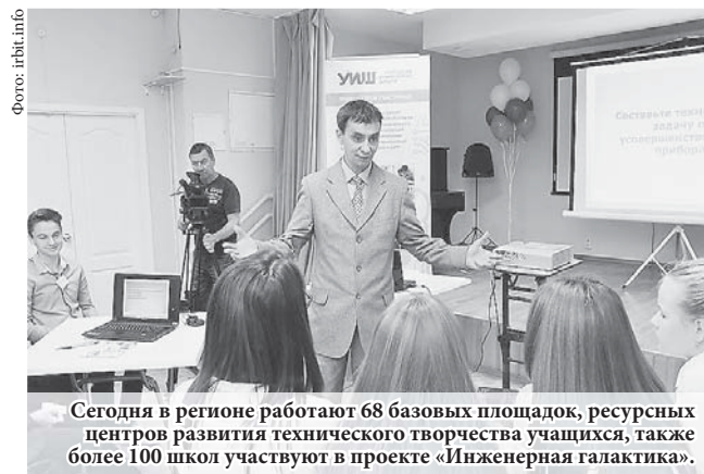
Сегодня в регионе работают 68 базовых площадок, ресурсных центров развития технического творчества учащихся, также более 100 школ участвуют в проекте «Инженерная галактика».

Отметим, что в 2016 году благодаря проектам областного Дворца молодёжи и Института развития образования в Свердловской области почти на 60% увеличилось число детей, занимающихся техническим творчеством.