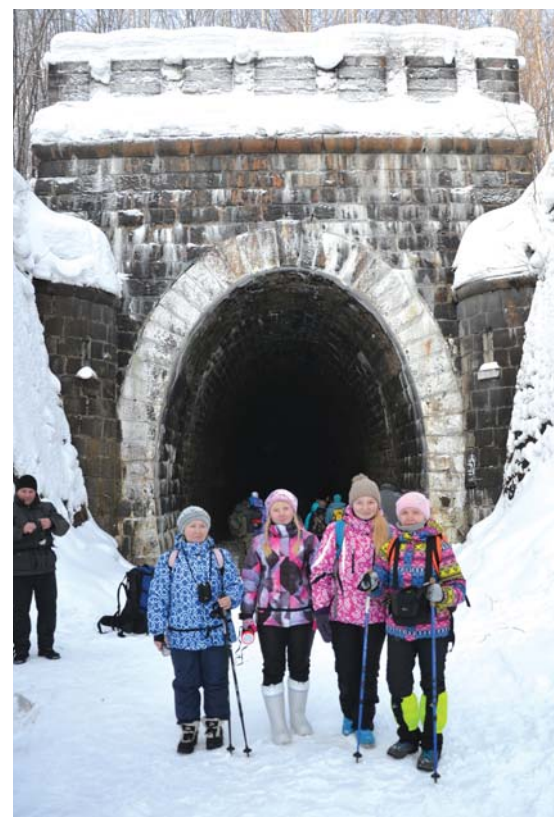
«Рифей» на сайте «ВКонтакте»: vk.com/tikcvr . Присоединяйтесь к бывалым туристам и вместе с ними открывайте для себя новые дороги!