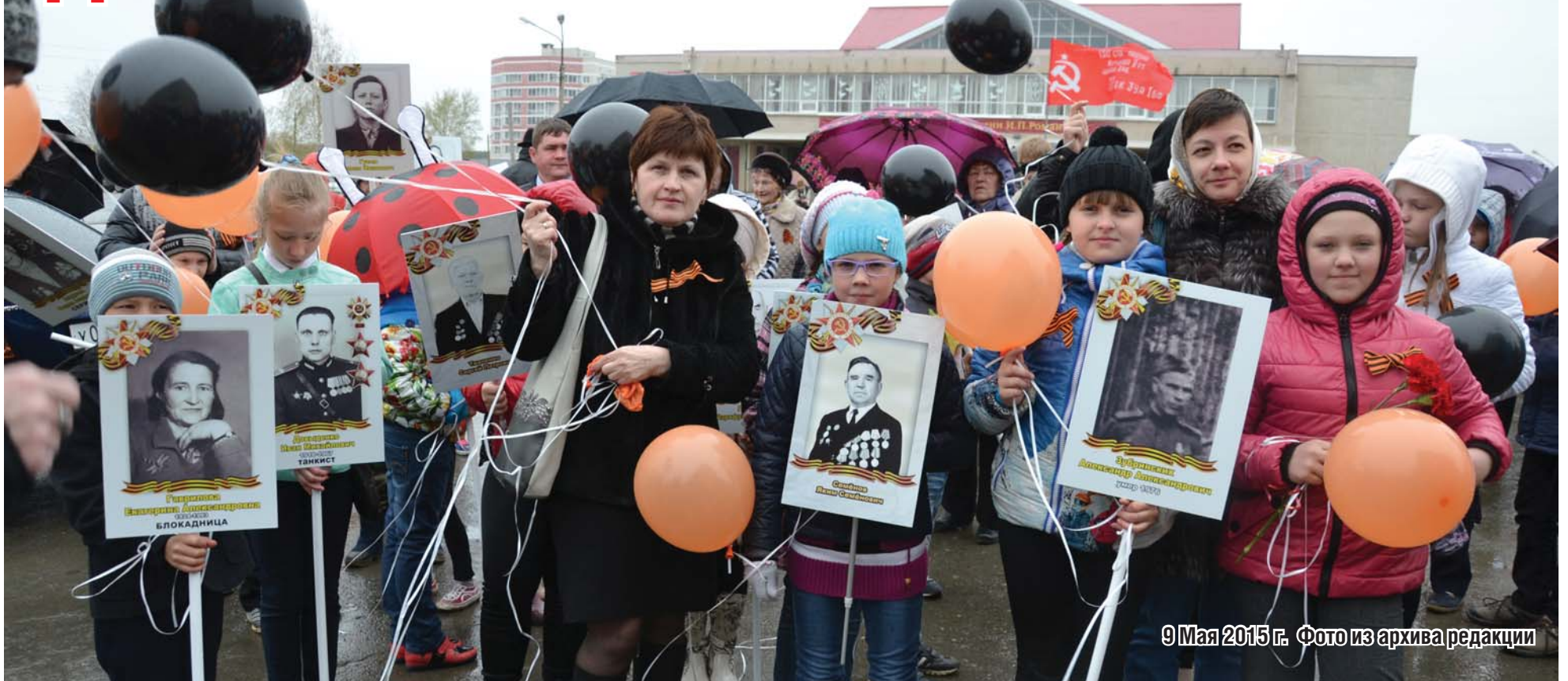
9 Мая 2015 г.

Уважаемые жители Сысертского городского округа! Дорогие наши ветераны!