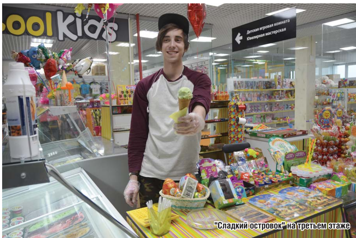
"Сладкий островок" на третьем этаже

Один из таких «сладких» островков находится на третьем этаже. И порой ребятам трудно удержаться от соблазна учудить на эскалаторе что-нибудь эдакое.