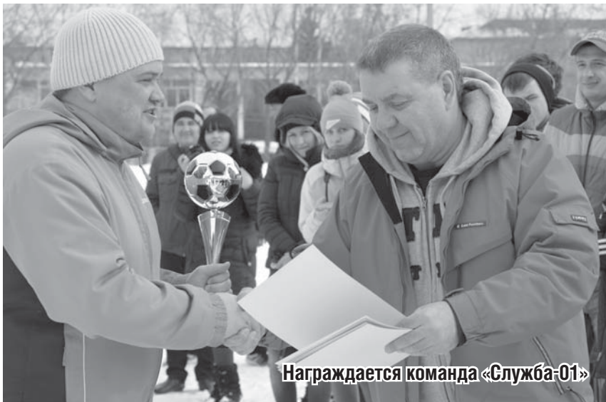
Награждается команда «Служба-01»