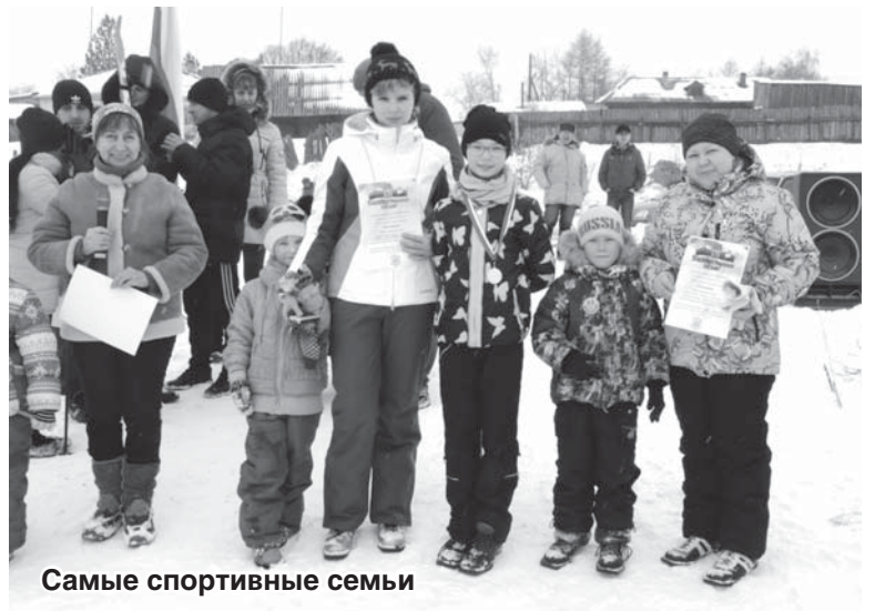
Самые спортивные семьи

ТРЕБУЮТСЯ ТРЕБУЮТСЯ ТРЕБУЮТСЯ ТРЕБУЮТСЯ ТРЕБУЮТСЯ ТРЕБУЮТСЯ