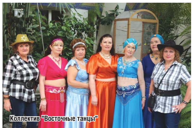
Коллектив «Восточные танцы»