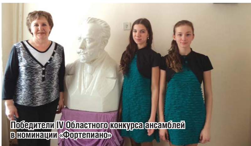
Победители IV Областного конкурса ансамблей в номинации «Фортепиано»

6 февраля в г. Реж прошел II Открытый областной конкурс игры на народных инструментах «Коробейники». Наш городской округ представляла сысертская детская школа искусств.