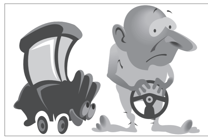
Иллюстрация Петра УПОРОВА.