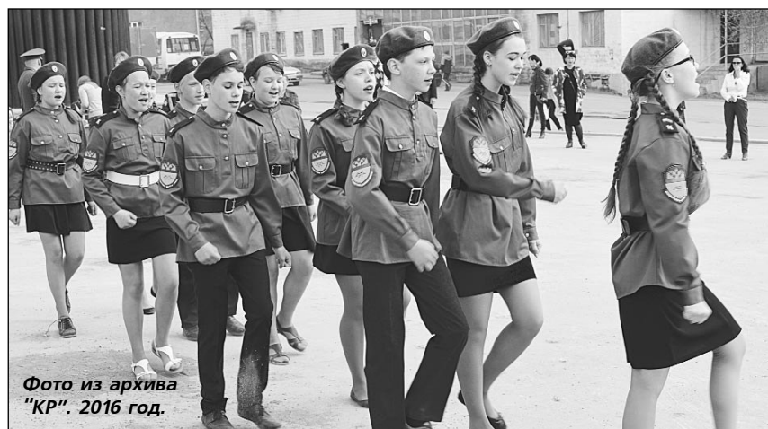
2016 год.

Академия гражданской защиты МЧС ( г.Москва).