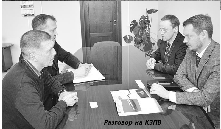
Разговор на КЗПВ