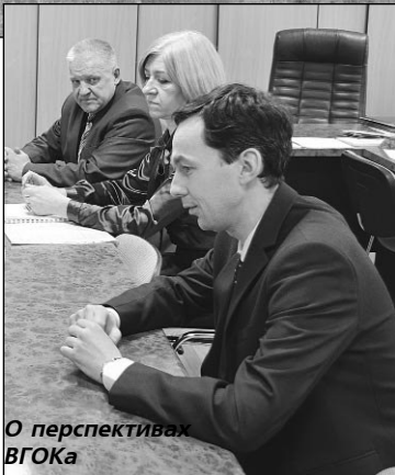
О перспективах ВГОКа