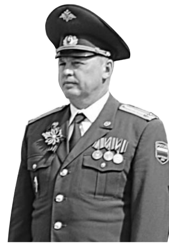
мечту и поступить в военно-учебные заведения?

- В 2016 году в Свердловской области в ходе предварительного отбора кандидатов было отобрано 1124 человека, все они прошли обследование военно-медицинской комиссией военного комиссариата Свердловской области, были оформлены и направлены в военно-учебные заведения их личные дела. После получения вызовов, для поступления убыло 854 человека, из которых 316 человек стали курсантами - 37 процентов из общего числа желающих надеть военную форму.