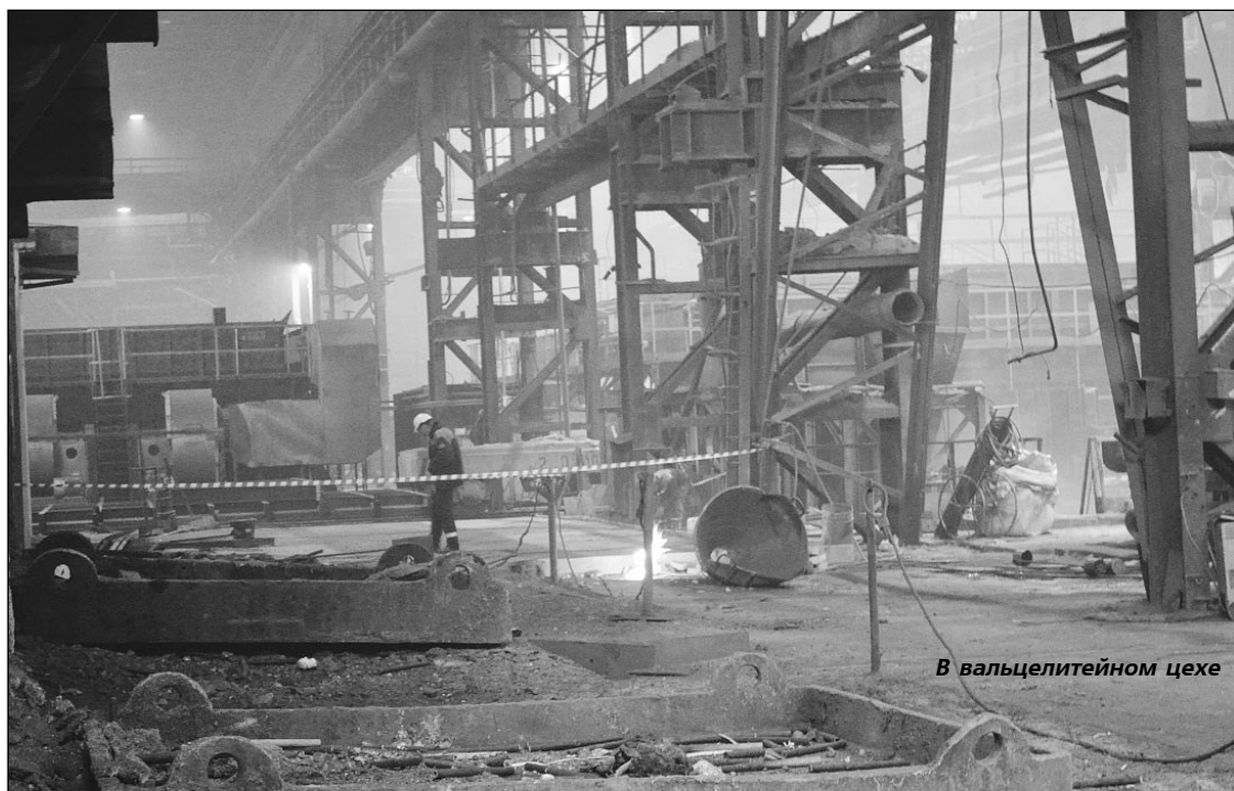
В вальцелитейном цехе