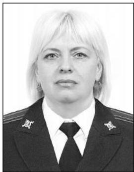
Административный участок №15.

(Продолжение. Начало в №47, 48, 49, 50, 2)