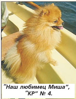
"Наш любимец Миша", "КР" № 4.