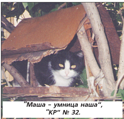
"Маша - умница наша", "КР" № 32.