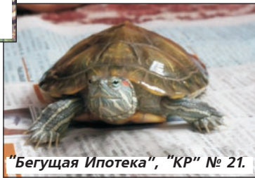
"Бегущая Ипотека", "КР" № 21.