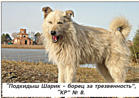
"Подкидыш Шарик - борец за трезвенность", "КР" № 8.