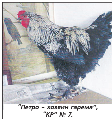
"Петро - хозяин гарема", "КР" № 7.

- так завершается рассказ об увлекательном и интересном собачьим мире Лисса.