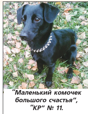
"Маленький комочек большого счастья", "КР" № 11.