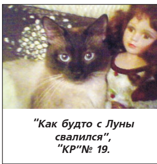
"Как будто с Луны свалился", "КР" № 19.