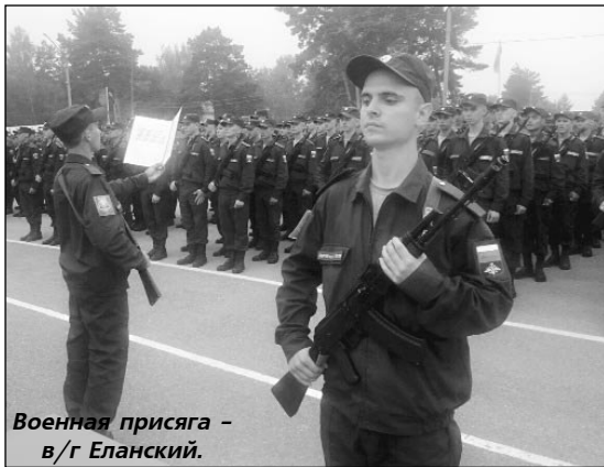
Военная присяга - в/г Еланский.