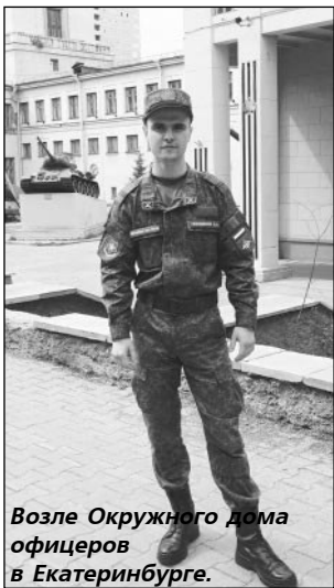
Возле Окружного дома офицеров в Екатеринбурге.