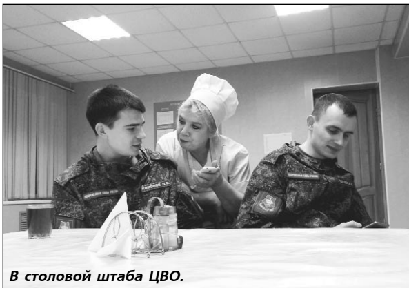
В столовой штаба ЦВО.