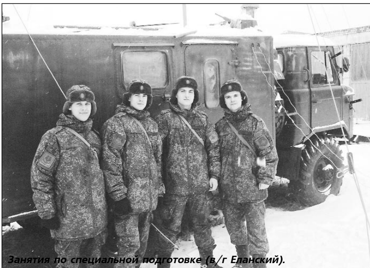
Занятия по специальной подготовке (в/г Еланский).

Подтверждением успешного выполнения поставленных задач для нас стали благодарственные письма и грамоты, а также присвоение командиром взвода очередного воинского звания младший сержант. Но не это главное.