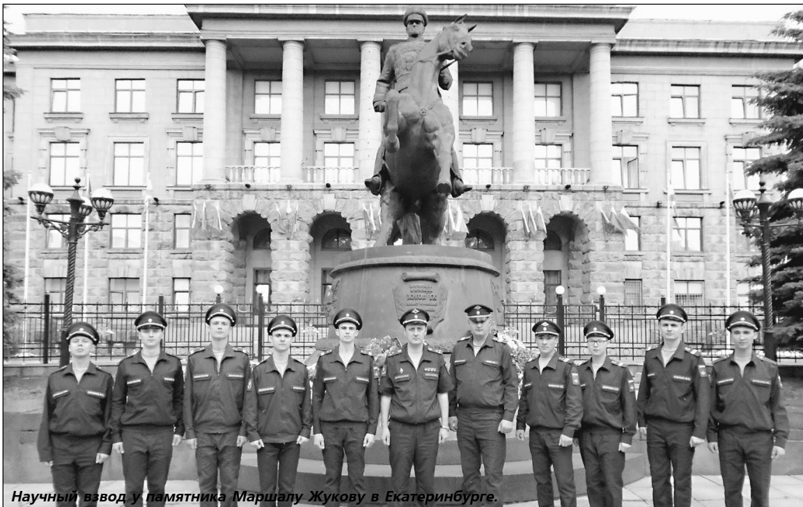
Научный взвод у памятника Маршалу Жукову в Екатеринбурге.