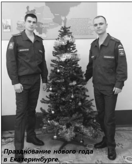
Празднование нового года в Екатеринбурге.

В течение всей службы нам встречались по-настоящему достойные и добросовестные офицеры и простые люди, которые поддерживали и помогали во всех сложных ситуациях. Я с теплом вспоминаю всех тех, с кем