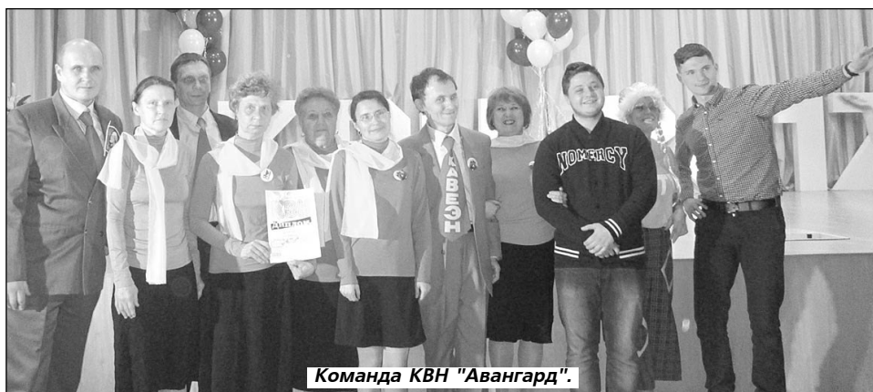
Команда КВН "Авангард".