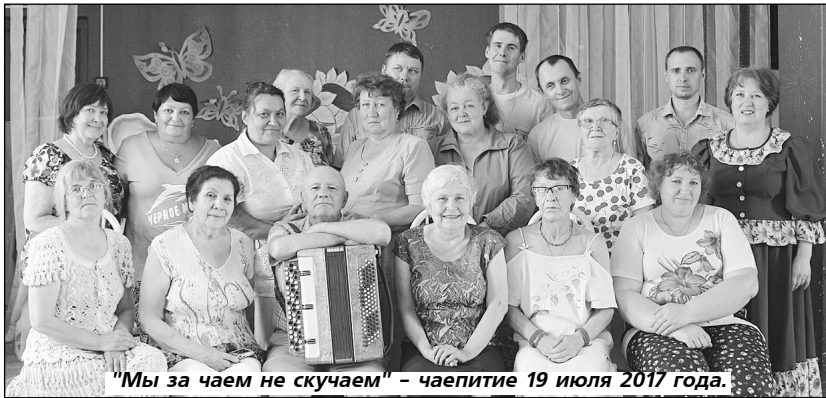
"Мы за чаем не скушаем" – чаепитие 19 июля 2017 года.

ВЕРНО говорят: "От суммы да от тюрьмы не зарекайся". Сюда бы следовало добавить: "И от инвалидности". Никто из нас не застрахован от этой беды – ДТП, болезни, разные жизненные обстоятельства, даже лишняя хромосома могут стать причиной инвалидности. Сегодня каждый десятый житель страны имеет такой социальный статус. Поэтому, пока в силах, пока можем – будем помнить, что рядом с нами есть люди, которым нужна помощь. И не только в декаду инвалидов. Хотя декада – это повод для большого и серьезного разговора о том, что может сделать общество для адаптации тех, кто по рождению или в силу обстоятельств имеет ограниченные возможности здоровья.