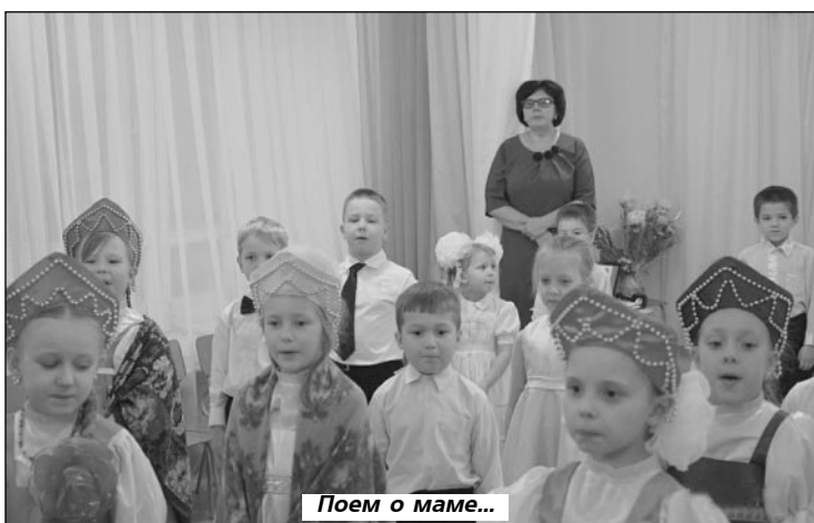
Поем о маме...