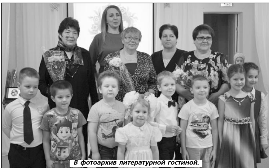
В фотоархив литературной гостиной.