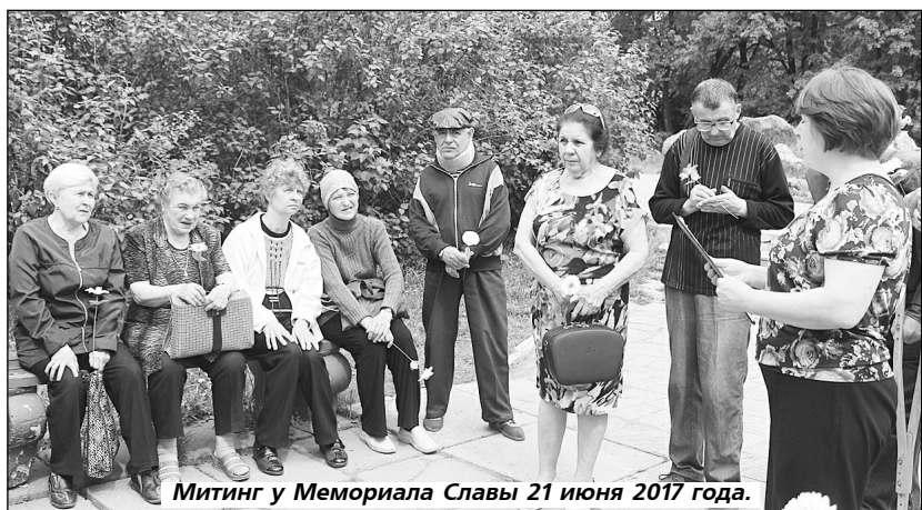
Митинг у Мемориала Славы 21 июня 2017 года.