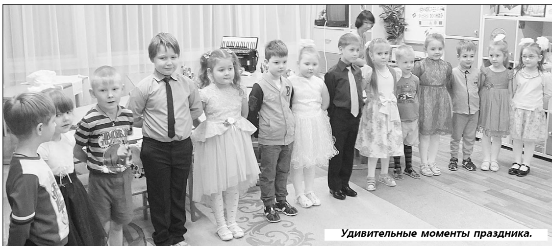
Удивительные моменты праздника.