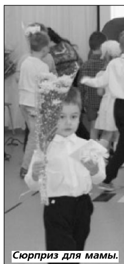
Сюрприз для мамы.

С каждым выступлением волна доброты набирала силу и была более высока, когда зазвучала мелодия песни о маме "главное слово, первое слово,"- дружно запел хор девочек и мальчиков! И настал очень приятный момент- "обнимашки" и вручение мамочкам и бабушкам корзиночек из живых цветов! Эти чудные композиции дети создали собственноручно на мастер-классе вместе с флористами магазина "Март".