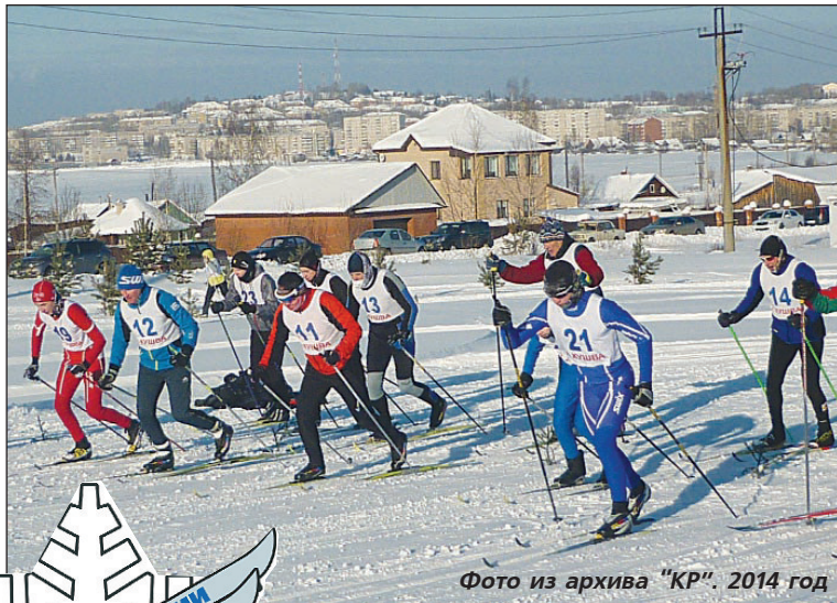
2014 год

Приглашаем жителей и гостей нашего города принять участие в борьбе за специальные призы "Лыжни России" в номинациях: "Самый старший спортсмен" (мужчина и женщина), "Самый юный участник" (мальчик и девочка), "Самая спортивная семья", "Самая массовая команда". Участники соревнований ждут памятные сувениры.