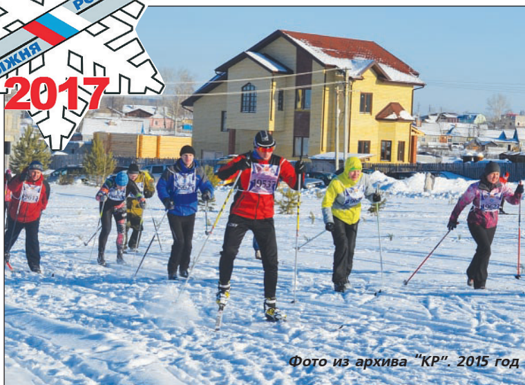
2015 год