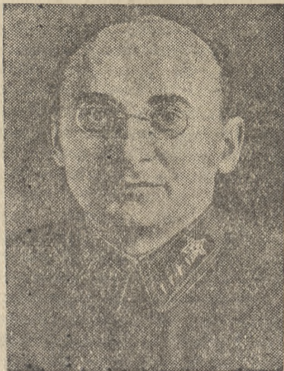
Зам. Председателя СНК СССР, Народный Комиссар Внутренних дел СССР, тов. Лаврентий Павлович БЕРИЯ.