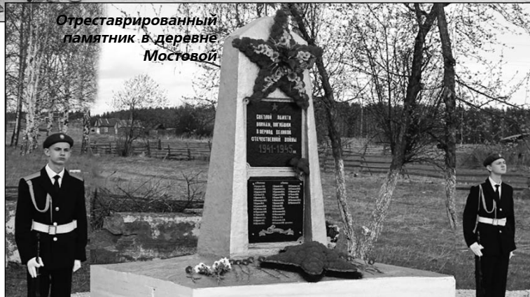
Отреставрированный памятник в деревне Мостовой

Продолжился фестиваль коллективно-творческим делом "И снова мы в строю..." с участием представителей ГИБДД, ВДПО, 206-й пожарной части, хутора "Кушвинский" и ВПЦ "Патриот". Согласно полученным маршрутным листам, ребятам нужно было пройти несколько пло-