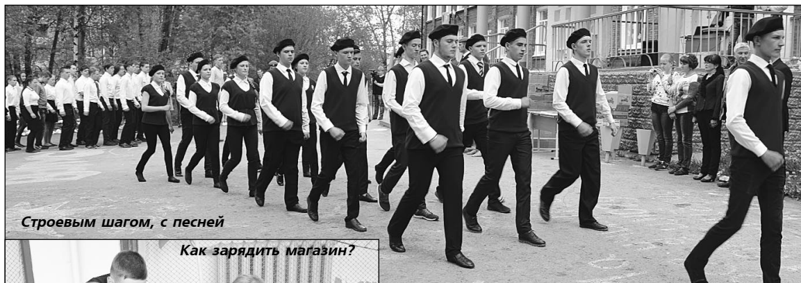
Строевым шагом, с песней

11 девушек и 51 юноша приняли участие в традиционных пятидневных учебных сборах