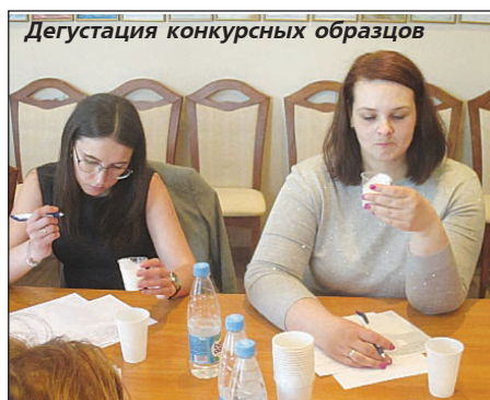
Дегустация конкурсных образцов