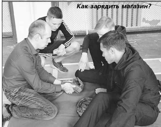
Как зарядить магазин?