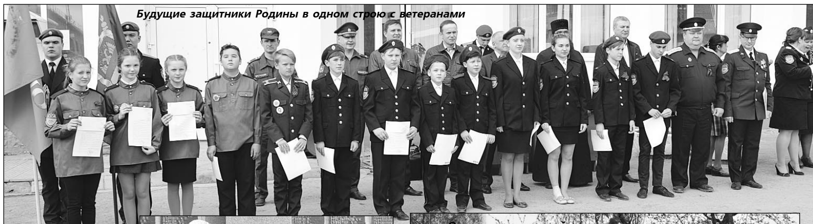
Будущие защитники Родины в одном строю с ветеранами

20 МАЯ в Кушвинском городском округе прошел День патриотического воспитания, организованный совместными усилиями управления образования, отдела культуры, Дома детского творчества и ветеранов Кремлевского полка.