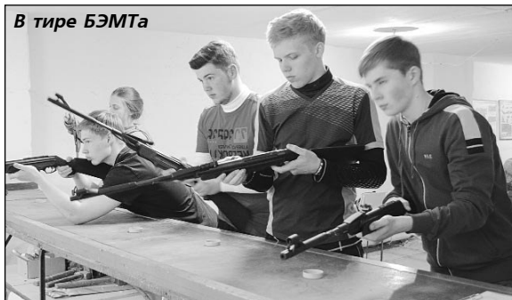
В тире БЭМТа