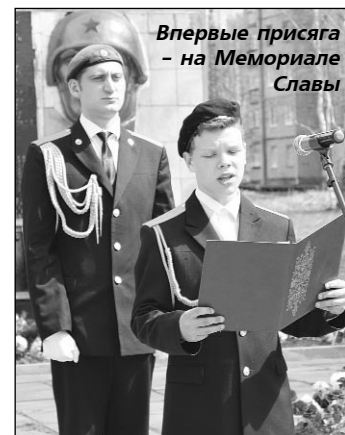
Впервые присяга - на Мемориале Славы