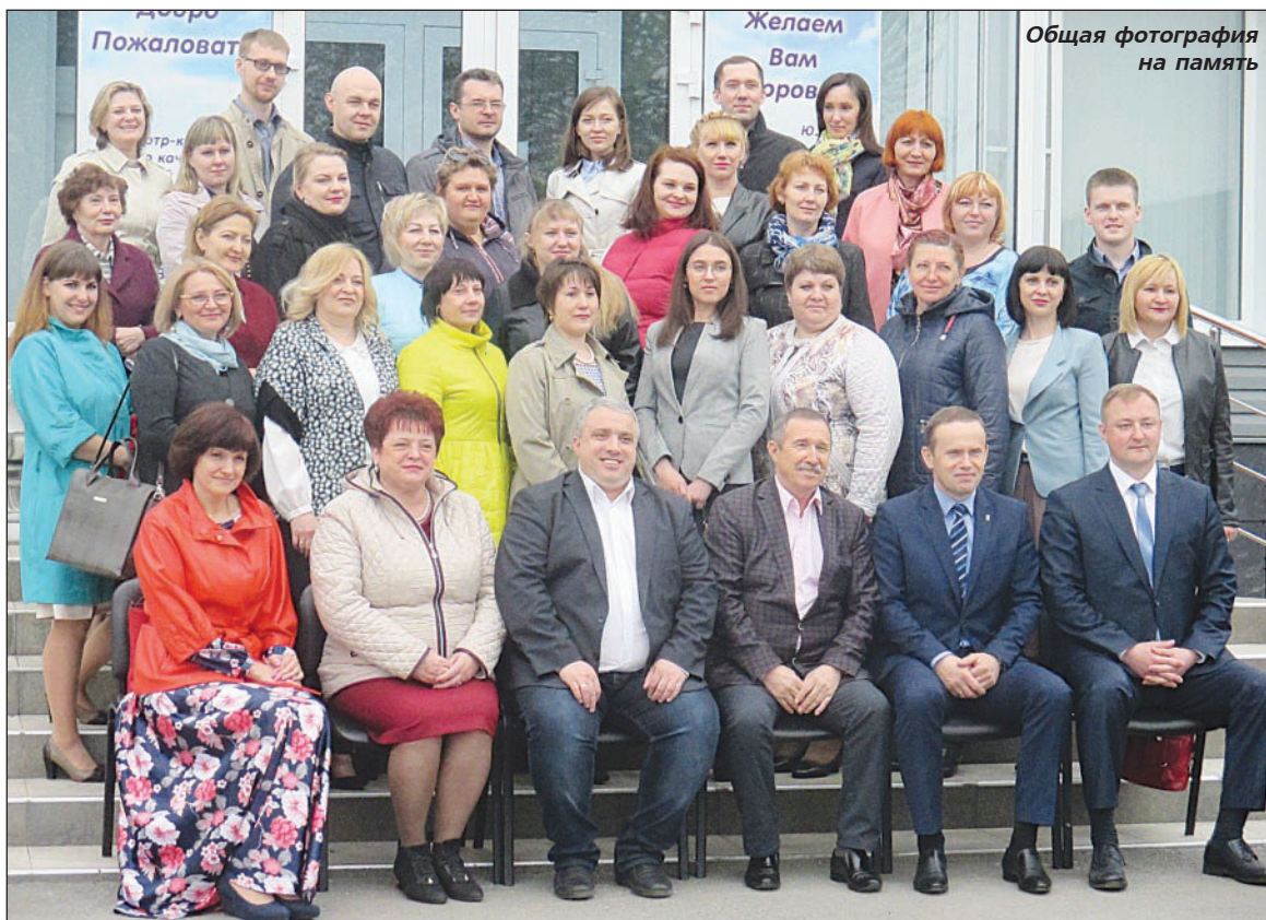
Общая фотография на память