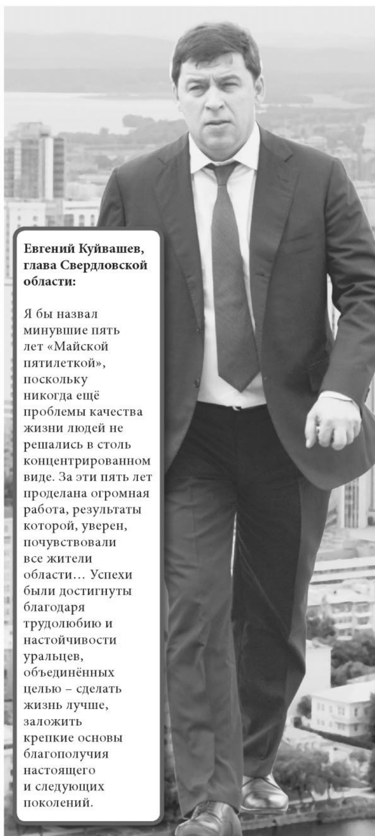
Евгений Куйвашев, глава Свердловской области: