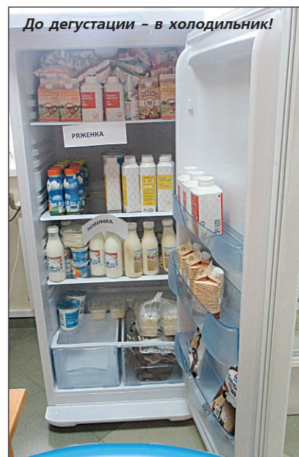
До дегустации - в холодильник!

26 МАЯ в Кушву приехали ведущие специалисты 13 предприятий производителей молочной продукции из Серова, Ирбита, Богдановича, Березовского, Ревды, Алапаевска, Талицы, Полевского, Новоуральска, Первоуральска, Туринской Слободы, Белоярского района, Верхней Пышмы, чтобы принять участие в ежегодном смотре-конкурсе качества молочной продукции.