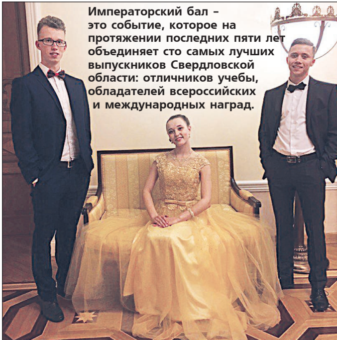
Императорский бал – это событие, которое на протяжении последних пяти лет объединяет сто самых лучших выпускников Свердловской области: отличников учебы, обладателей всероссийских и международных наград.

- Действительно, это был долгожданный для нас день. Открытие