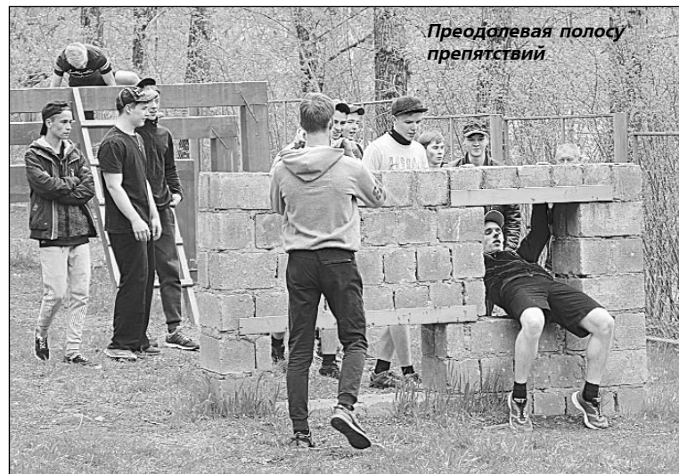
Преодолеваю полосу препятствий

В ПРОШЛУЮ пятницу завершились традиционные пятидневные учебные сборы для допризывников, учащихся 10-х классов школ городского округа, посвященные 70-летию автомата Калашникова.