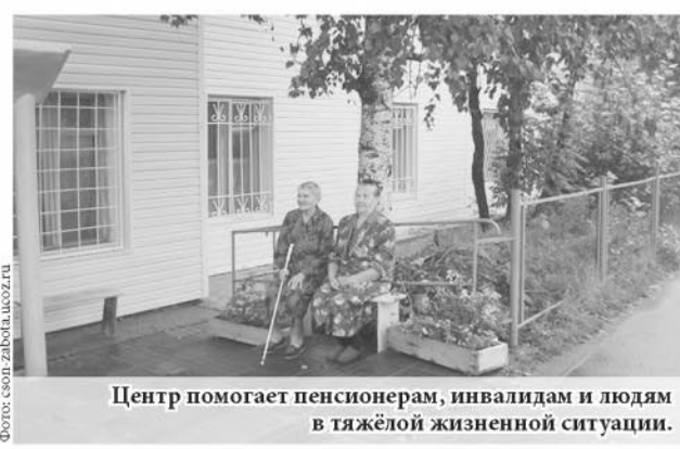
Центр помогает пенсионерам, инвалидам и людям в тяжёлой жизненной ситуации.