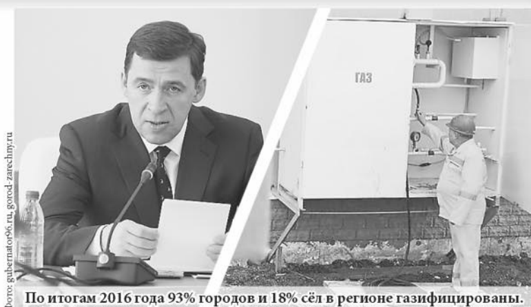
По итогам 2016 года 93% городов и 18% сёл в регионе газифицированы.

По поручению Евгения Куйвашева в Свердловской области будет расширен перечень получателей льгот на подключение жилых домов к сетям газоснабжения. Подготовку документов, предусматривающих соответствующие положения, министерство социальной политики региона завершит до 26 мая.