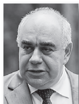
Аркадий Белявский, министр здравоохранения Свердловской области:

«Мы смещаем акцент с оказания медицинской помощи в круглосуточных стационарах на поликлиническую и амбулаторную помощь. В результате всех преобразований: оптимизации сети учреждений, внедрения эффективных контрактов удалось сэкономить 558 миллионов рублей, которые были направлены на повышение заработной платы медицинским работникам».