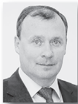
Алексей Орлов, первый вице-премьер – министр инвестиций и развития Свердловской области:

В областной фонд поддержки предпринимательства поступило свыше двух тысяч заявок на предоставление средств. На финансовую поддержку 700 субъектов предпринимательской деятельности было направлено 912,4 миллиона рублей. Субсидии направлялись на модернизацию, на уплату первого платежа по лизингу.