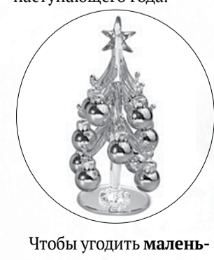
Чтобы угодить малень-

Очень уместным новогодним подарком будет живое растение в горшке, ведь стихией следующего года будет дерево. Можно подарить изделия из дерева - поднос, коробку для рукоделия, рамки для фотографий, сувенирные ложки - и упаковать в синюю или зеленую бумагу, подчеркнув цвет символа наступающего года.