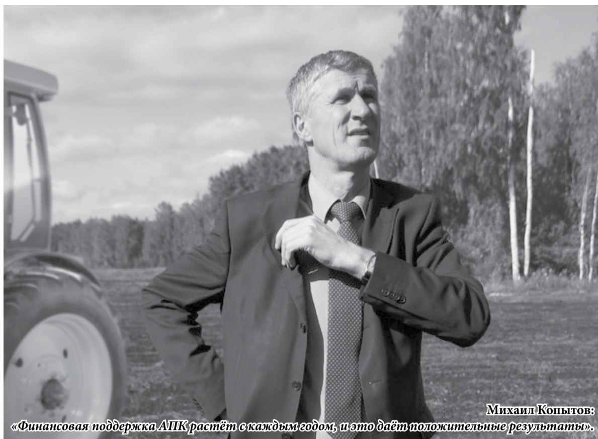
Михаил Копытов: «Финансовая поддержка АПК растёт с каждым годом, и это даёт положительные результаты».

Денис Паслер, председатель правительства Свердловской области: – На 2015 год правительство области сформировало бюджет так, чтобы в полном объеме сохранить все меры поддержки сельхозпредприятий.