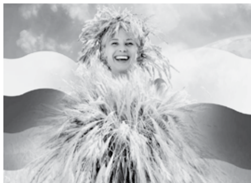
Эмбарго – не помеха АПК