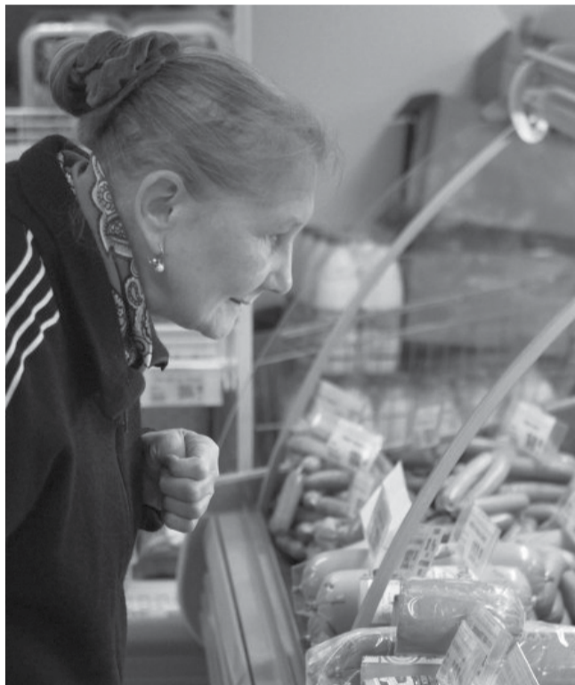
Прилавки пока не пустуют, но цены уже кусаются

А вот рыба (свежемороженая горбуша) не столь стремительно растет в цене: со 167 руб. до 180 руб. (в