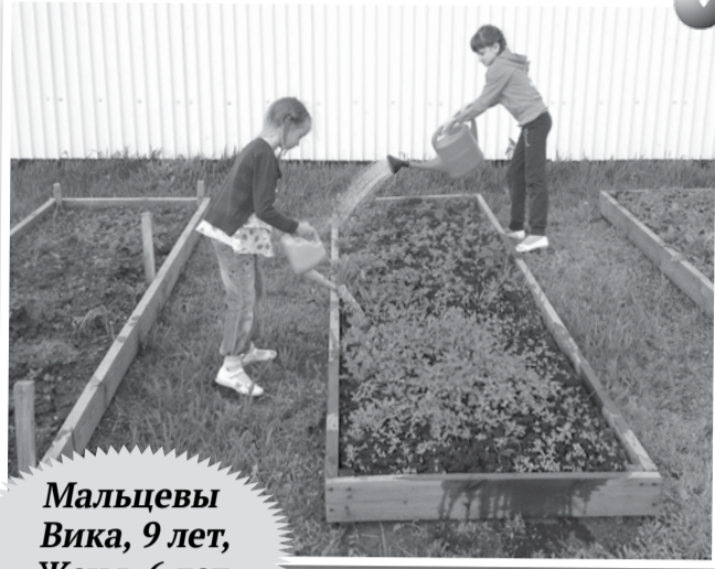
Мальцевы Вика, 9 лет, Женя, 6 лет

Шире ротик открывай, Побыстрей, братишка, вырастай, Вместе будем мы играть, Вместе маме помогать.