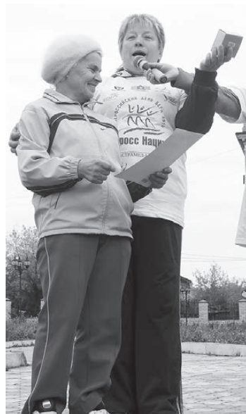
Награждение самой возрастной участницы кросса

В минувшую субботу во всех городах и населенных пунктах нашей огромной страны сотни и тысячи людей одновременно побегали. Верхняя Тура не стала исключением! В нашем городе тоже прошел пробег в рамках Всероссийской, уже 14-ой по счету, акции «Кросс нации».