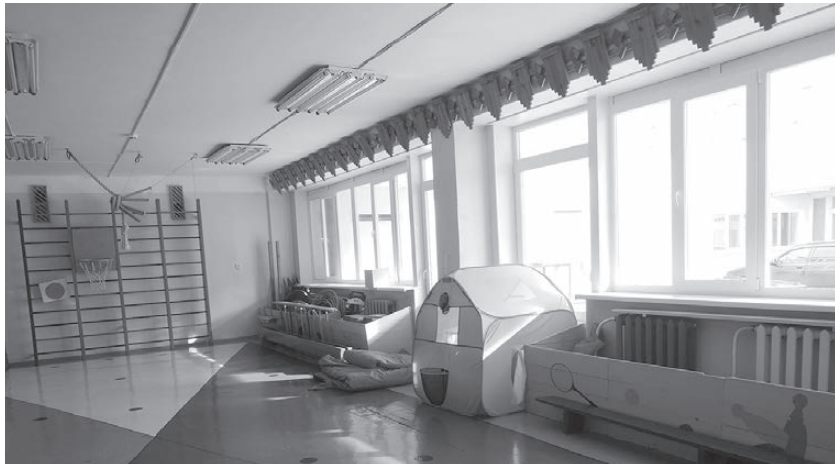
С новыми окнами в спортзале «Сказки» стало и тепло, и светло

Я приглашаю вас сегодня на прогулку по саду. Только это будет не привычный для нашего понимания «сад»: с плодовыми деревьями, цветами и грядками. Нет, это будет особенное место, там проводят большую часть своего времени наши драгоценные «цветы жизни». Догадались? Именно, я приглашаю вас в детский садик - в «Сказку».