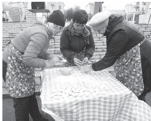
Команда «Подруги» - победитель конкурса по лепке пельменей

Когда все немного подкрепились, началась развлекательно-игровая часть народного гуляния. Одним из ярких моментов стал праздничный перепляс - представление уральского пельменя. Верхнетурицы на «ура» встречали украинскую польку, русский народный