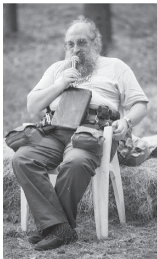
А. Вассерман - человек-загадка

Участниками сбора проекта «Сеть» на Селигере стало более 100 молодых людей из 11 регионов - от Владивостока до Калининграда. В течение 10 дней ребята посетили несколько тренингов и лекций по риторике и технологиям воздействия на аудиторию, политической и социальной психологии и геополитике. В гости к активистам пришло много известных людей: директор Московской школы нового кино Илья Шерстобитов, политконсультант и журналист Анатолий Вассерман,