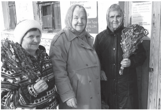
Пенсионерки из Кушвы - постоянные посетительницы верхнетуринской бани

- Мы из Кушвы, - говорят первые посетители, все – женщины пожилого возраста. - Приезжаем сюда каждую неделю. Почему именно сюда? Потому что недорого (в Кушве – 200 (!), а в Верхней Туре – всего лишь 80 рублей). Да и пар здесь очень