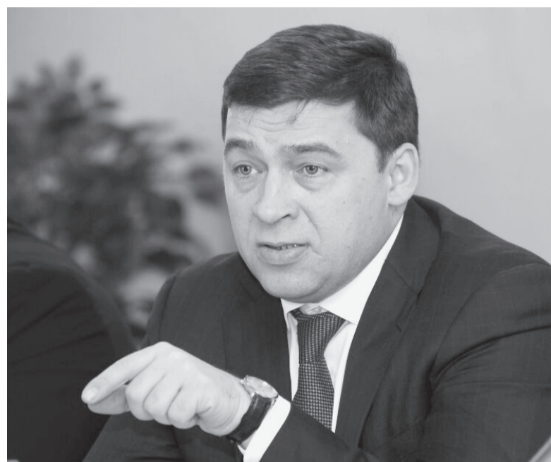
Евгений Куйвашев, губернатор Свердловской области: «Жду от глав действующих мер по снижению задолженности. Предупреждаю, что мы проанализируем ситуацию и динамику работы в разрезе каждого муниципалитета и примем соответствующие решения».

Средства областного бюджета приходится направлять на погашение долгов муниципалитетов за топливно-энергетические ресурсы, вместо того, чтобы направлять их на подготовку жилого фонда и сетей к отопительному сезону. Говоря об этом, губернатор Свердловской области Евгений Куйвашев поручил министерству энергетики и ЖКХ провести тщательный анализ в работе каждого муниципалитета-должника.