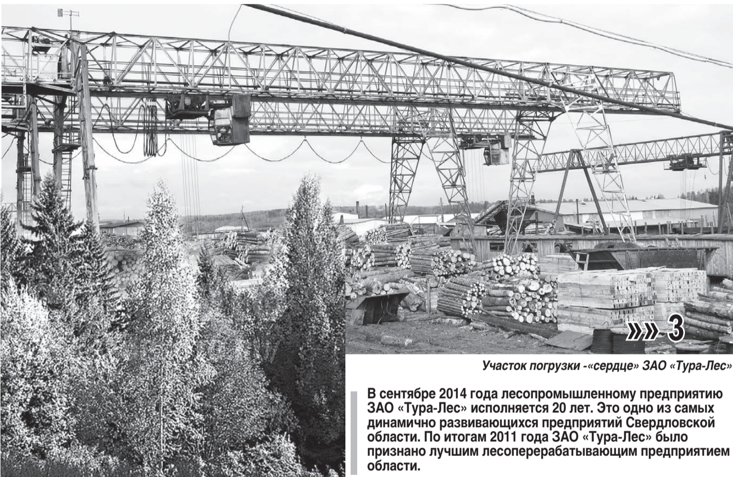
Участок погрузки - «сердце» ЗАО «Тура-Лес»

В сентябре 2014 года лесопромышленному предприятию ЗАО «Тура-Лес» исполняется 20 лет. Это одно из самых динамично развивающихся предприятий Свердловской области. По итогам 2011 года ЗАО «Тура-Лес» было признано лучшим лесоперерабатывающим предприятием области.