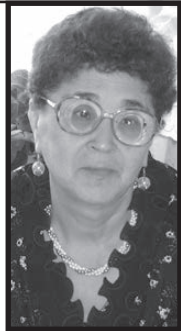
Дочь, зять, внуки

Всегда ты говорила: «Все отлично», Хоть нестерпимой боль твоя была. В твой дом всегда-всегда тянулись люди И с радостью, и с горестью в душе. Ведь знали, никого ты не забудешь, Поддержишь всех и в счастье, и в беде. Теперь, родная, спи спокойно, Тебя мы будем помнить до конца. А час придет мы встретимся с тобою Не на земле уже, а в небесах.