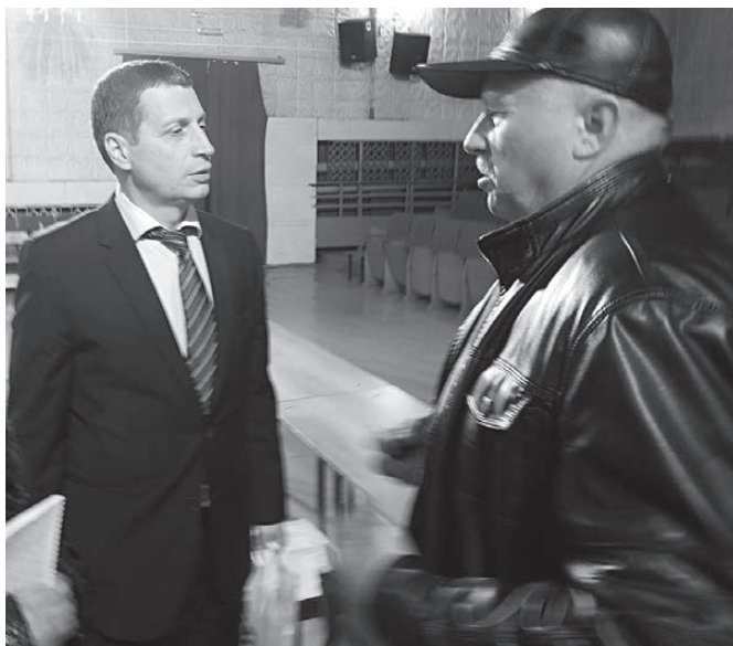
Встреча закончилась, а вопросы к министру остались

- В июле этого года в рамках совместного расширенного заседания Правительства области и глав муниципальных образований прошел турнир по волейболу среди команд управленческих округов Свердловской области. Е. Куйвашев перед началом турнира