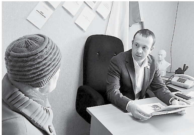
Приём граждан в Богдановиче

прерывный диалог с населением региона, и, в первую очередь, с жителями Камышлова, Пышмы, Талицы, Богдановича и Арамили.