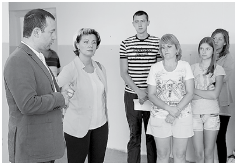
Встреча с переселенцами с Украины

– В их глазах я увидел отчаяние и в то же время надежду на новую жизнь, вдали от бомбёжек, выстрелов и кровопролития. Всех граждан, приезжающих к нам с территории Украины, в первую очередь интересуют вопросы по оформлению документов и приобретению статуса беженца, бла-