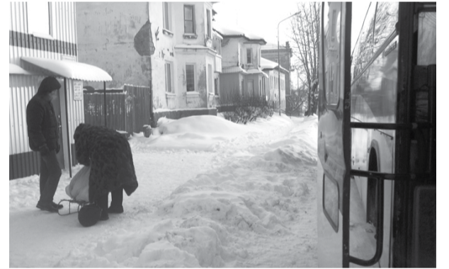
Сегодня, во вторник (21 января-прим. ред.) брустверы по-прежнему не расчищены, разве что пассажиры протоптали в них дорожки.

Насколько я знаю, силами «Благоустройства» в выходные дни уже были прочищены основные дороги и улицы, а территория автостанции, как обычно, осталась на потом – в самую последнюю очередь, несмотря на то, что с МУ «Служба заказчика» у нас заключен договор на расчистку территории от снега. Я звонила в «Службу заказчика», в «Благоустройство», писала письмо в администрацию и отовсюду слышу ответ, что в первую очередь расчищаются особо значимые территории. Но ведь и у нас люди, которые также требуют к себе внимания и работы.