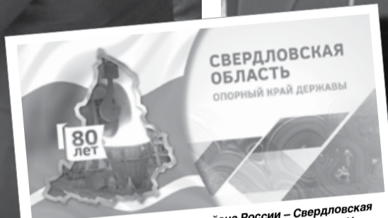
Центр старопромышленного района России – Свердловская область – отметила 17 января 2014 года свое 80-летие. На торжественное собрание в Екатеринбург съехались более 2000 гостей из городов Среднего Урала и других регионов. Выставка, добрые слова официальных коллективов, подарки... людям, концерт именитых уральских коллективов, подарки... Это событие стало точкой отсчета для новых свершений Свердловской области.