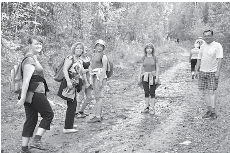
Вперед, за отрыми ощущениями

Древние уральские горы, возраст которых 500 миллионов лет. Высота более 1500 километров над уровнем моря. Непроходимая тайга, лесотундра, гористые массивы. Вот что представляет собой путь к самой высокой точке Свердловской области – к Конжаковскому камню. Каждый год этот путь пытаются преодолеть тысячи туристов со всей страны. Но удается это единицам.