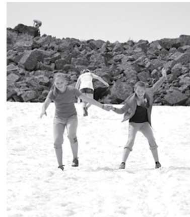
Дети были в вострге от снега