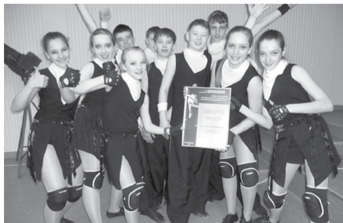
Танц-шоу - призер конкурса