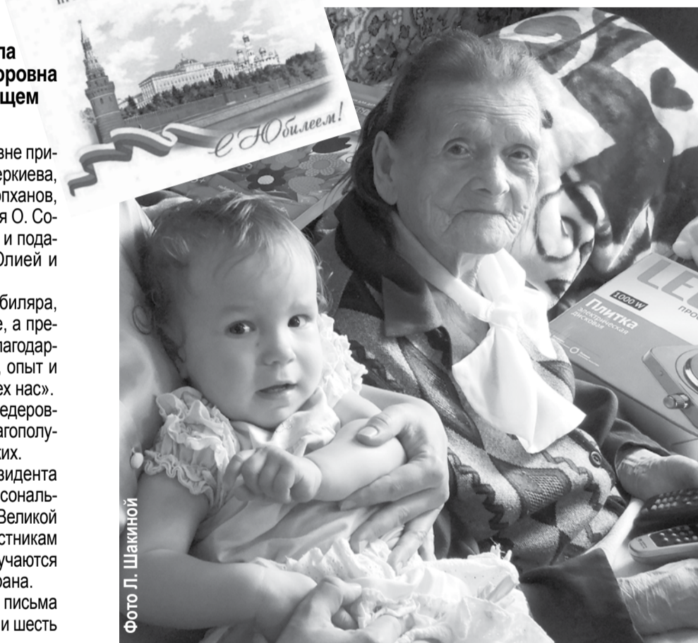
Незадолго до 100-летнего юбилея прапрабабушки Аленке исполнился один год