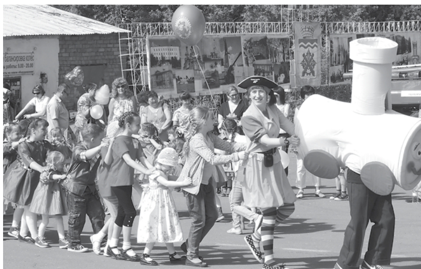
На веселом паровозике - в город Детства

и певцов ждала «Минута славы». В режиме свободного микрофона дети читали стихи, пели песни, частушки, поддерживаемые аплодисментами благодарных зрителей. Для книголюбов в городском сквере работал выездной читальный зал, а в одном из уголков городской площади на фотовыставке все желающие могли представить свои работы. Все активные