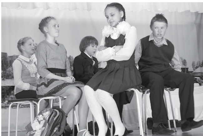
Юные театралы порадовали премьерой спектакля

А на центральной площадке праздника юных декламаторов