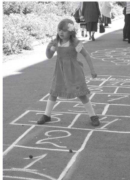
Теперь можно и в классики поиграть!

А в это время на площади города стартовала большая праздничная программа, в рамках которой прошли парад детских колясок, детскотека, выступления творческих коллективов Городского центра культуры и досуга. Блеснуть своими талантами и научиться чему-то новому