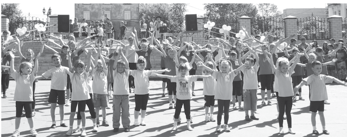
Флэшмоб юных танцоров зажег всех участников праздника!

По-особенному празднично в этом году прошел в нашем городе День защиты детей. Все организаторы праздника подготовили для юных верхнетуринцев множество интересных игр и забав, приятных сюрпризов, которые никого не оставили равнодушными. В этот день городская площадь на несколько часов превратилась в настоящий город Детства, где дети пели и танцевали, играли, ставили спортивные рекорды!