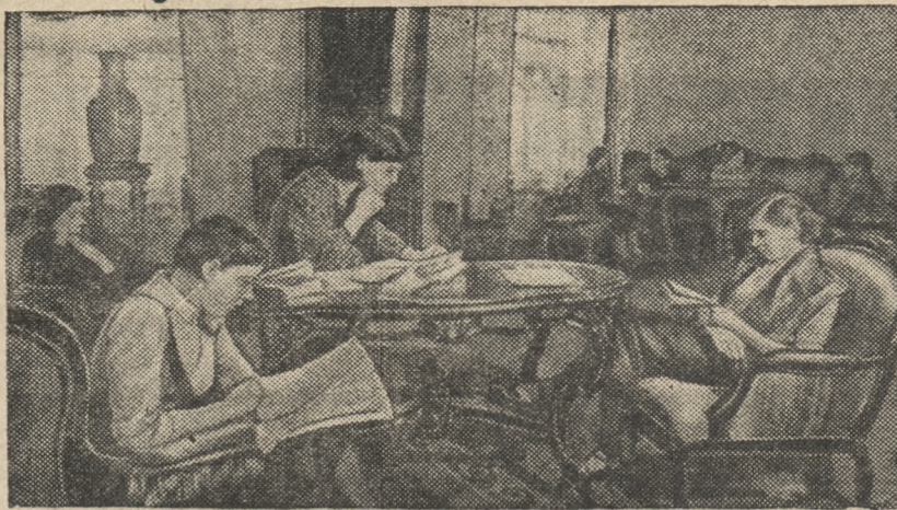
На снимке: в гостиной Дома отдыха матери и ребенка на Кировских островах (Ленинград).