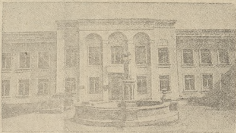
На снимке: жилой дом в гор. Сталибаде.

Подготовить отличные семена в необходимом количестве к севу—дело чести всех партийных и комсомольских организаций деревни, председателей колхозов и сельских советов, специалистов и работников земледельческих органов. Активное участие в этом деле должны принять агрономы, которые обязаны неслобно следить за ходом подготовки к весне, состоянием семенных фондов и использованием зерноочистительных машин.