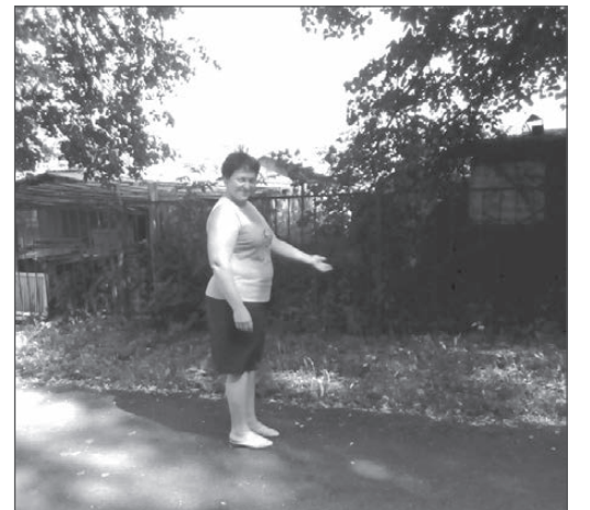
Змея уползла за забор в сторону соседних гаражей.