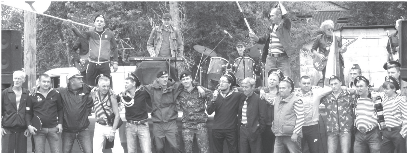
Моряки бывшими не бывают!