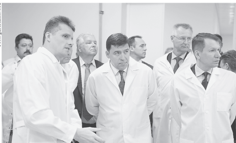
В Екатеринбурге открылся центр позитронно-эмиссионной томографии. Ежегодно здесь будут проходить обследование 6 тысяч уральцев.