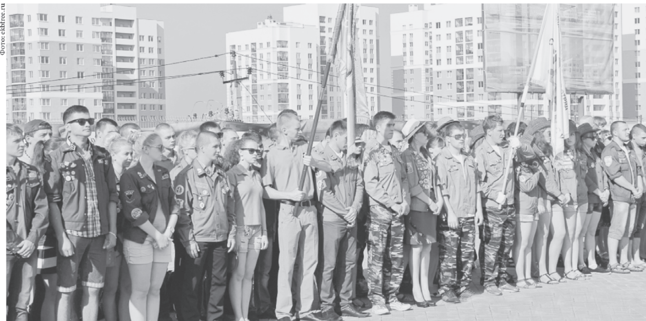
По данным статистики, с начала 2016 года в Свердловской области сдано в эксплуатацию более 600 тысяч квадратных метров жилья. Более 95% стройматериалов производится на территории региона. На фото: стройотряды активно участвуют в строительстве жилья.

Отметим, согласно июньским рейтингам компании «МедиаЛогия» регион занимает лидирующие позиции в РФ по реализации «майских указов» Владимира Путина. Так, в социальной сфере Средний Урал – на первом месте. В сфере экономики, а также в сфере ЖКХ – на второй позиции. «Майские указы» – это перечень основных необходимых статей для социально-экономического развития региона. Векторы развития, которые даются президентом, укладываются в нашу стратегию развития региона до 2030 года», – отметил Евгений Куйвашев.