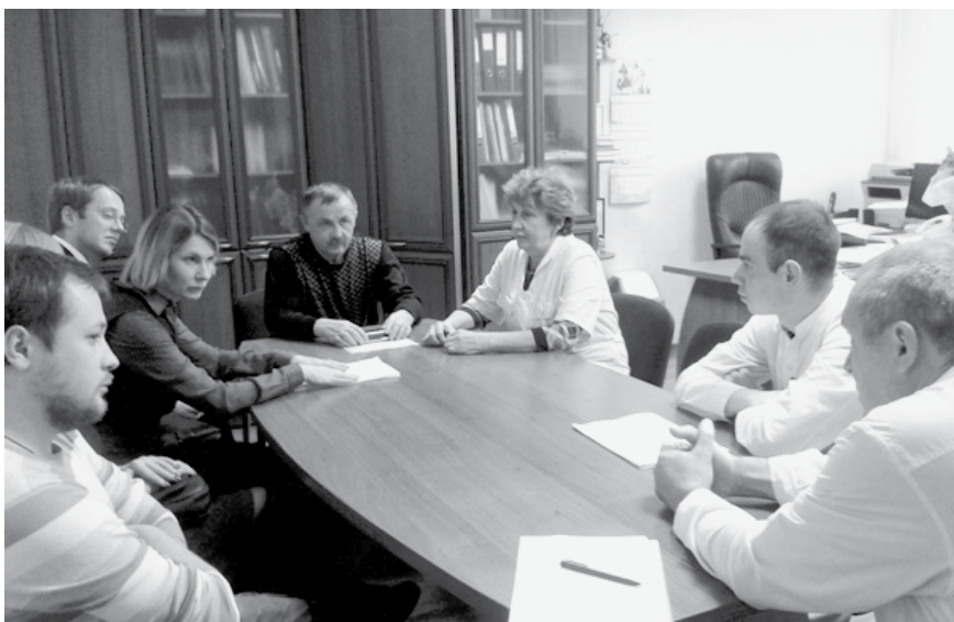
Депутаты на встрече с врачами больницы.