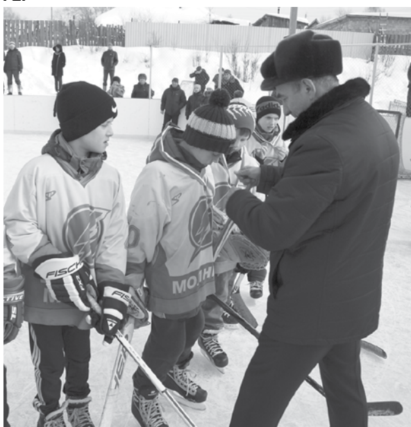
Золотые медали «Молнии-1» вручил глава города Александр Брезгин.

И вот звучит финальный свисток судьи, турнир завершен. Победителем турнира стала команда «Молния-1». На втором месте - команда девушек «Уралочка» (г. Первоуральск), на третьем - «Горняк» (г. Кушва). Четвертое место заняла команда «Мечта» (г. Нижний Тагил), пятое - «Молния-2», шестое место у команды «Кристалл» (г. Качканар).