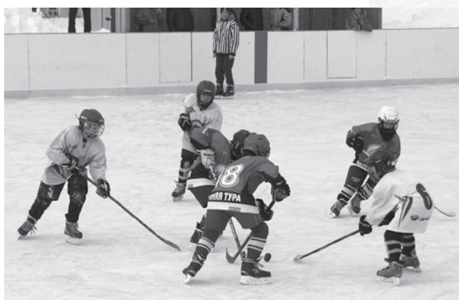
Финальный период последней игры турнира. «Молния-2» ведет со счетом 5 : 2.