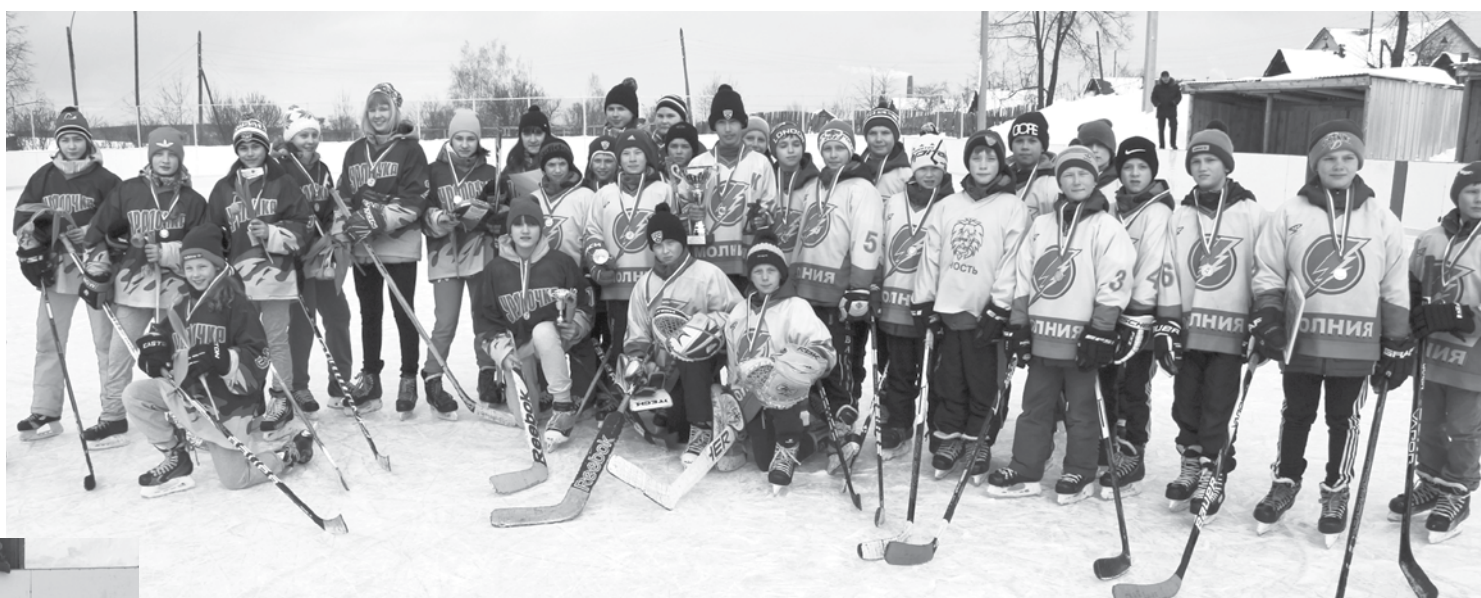
Команды «Уралочка» и «Молния-1»: цветы самым классным и самым прекрасным соперницам.