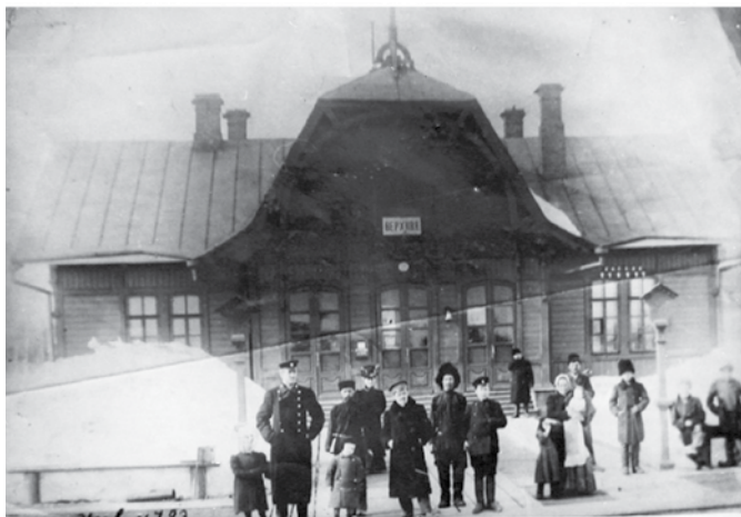
Железнодорожная станция Верхняя, начало XX века.