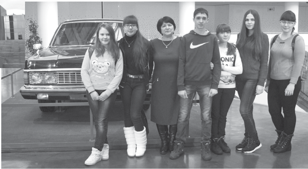
Фото на память на фоне лимузина Б. Ельцина

При желании можно отправиться в 90-е годы: увидеть на пустом прилавке магазина лишь салат «Дальневосточный» из морской капусты и старые деньги, посмотреть старенький телевизор «КВН» и посидеть в троллейбусе, за окнами которого уличный пейзаж двадцатилетней давности... Ощутить прошлое можно, посетив «Ельцин - центр», открывшийся 25 ноября 2015 года в Екатеринбурге.