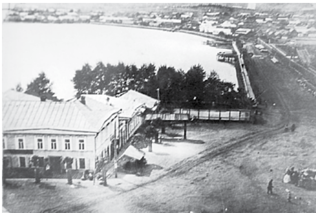
Так выглядела городская площадь в 1907 г.

Вглядись, читатель, в эти фотографии, запечатлевшие наш город в разные годы. Его жители так же, как и сейчас, работали, любили, радовались, огорчались, пели... Это наше прошлое, о котором многие из нас не имеют представления. Пройдет время, и фотографии нашего дня станут историей.