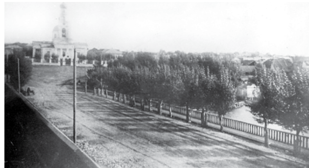
Никольский собор и вид на городскую площадь с западной стороны. 1907 г.

Возможно, в вашем фотоархиве есть фотографии старого города. Принесите их в редакцию, и мы опубликуем их.