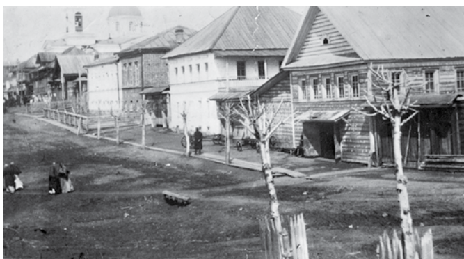
Улица Церковная (ныне Советская). Вид на площадь и Никольский храм. 1907 г.