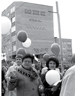
МЖК - 1