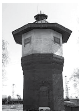
Водонапорная башня у ж/д вокзала