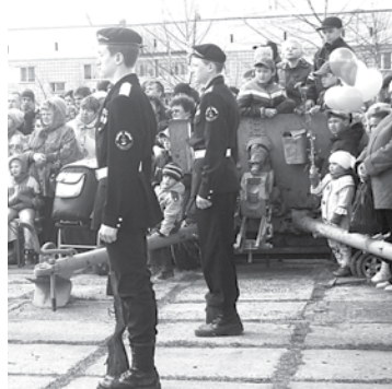
Пушка на Мемориале Славы