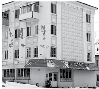
Дом № 1 по ул. Машиностроителей (маг. «Центральный»)