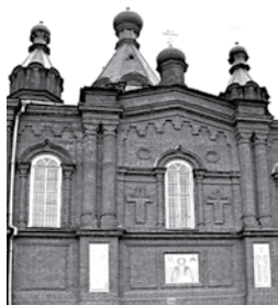
Храм Александра Невского