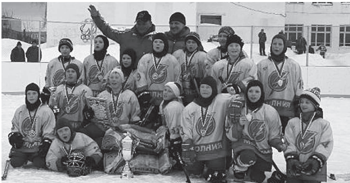
Верхнетуринские хоккеисты - золотые...

Во второй день соревнований уверенную победу одержали хоккеисты «Олимпа» (г. Ревда), серебро турни-