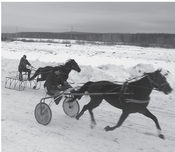
Только ветер свистит...