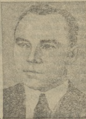
Николай Николаевич Поликарпов.