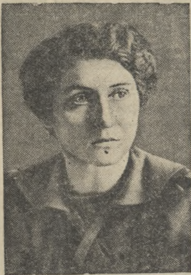
Выдающаяся советская писательница автор замечательных книг о жизни и борьбе польского народа, депутат Верховного Совета СССР Ванда Васильевская.

Китаю американского кредита в размере 100.000.000 долларов. (ТАСС).