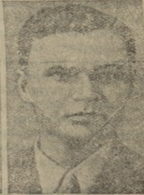
Василий Гаврилович Грабин.