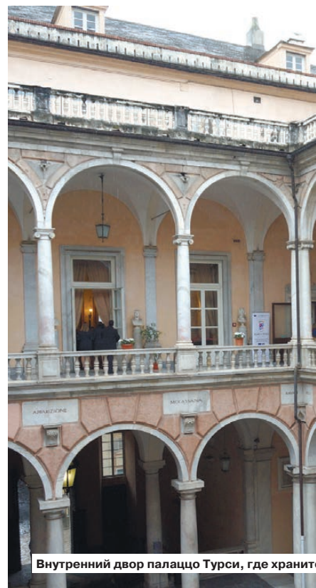
Внутренний двор палаццо Турси, где хранятся коммунистические газеты

Как-то на улице, зацепив нашу речь, симпатичные молодые парни-продав-