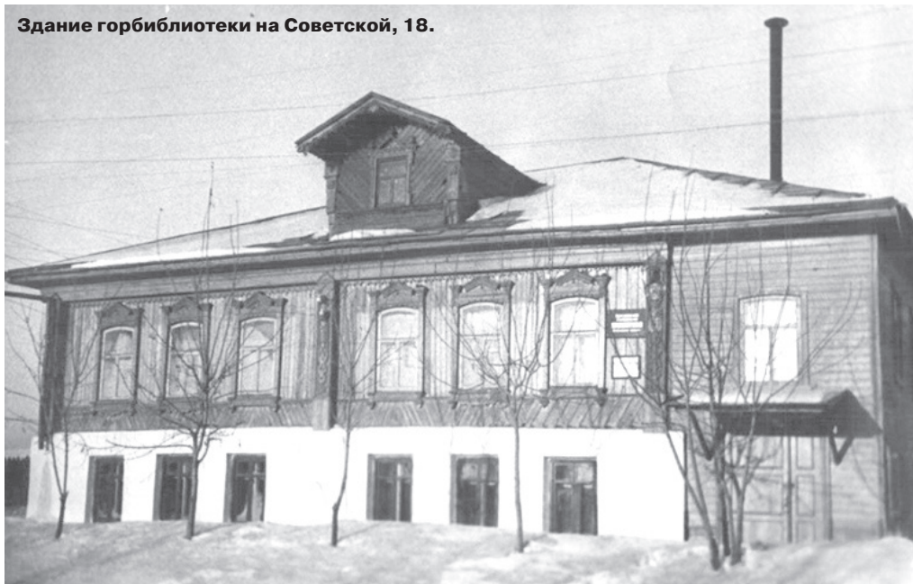
Здание горбиблиотеки на Советской, 18.