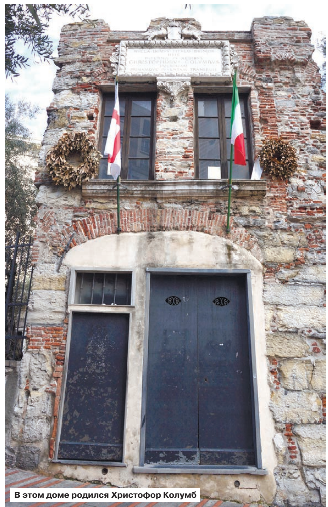
В этом доме родился Христофор Колумб

В октябре 1839-го Паганини в последний раз в жизни посещает родную Геную. Он очень плохо себя чувствует, у него сильно опухают ноги, музыкант не в состоянии взять в руки смычок. Любимая скрипка лежала с ним рядом, и он пальцами перебирал струны. 58-летний виртуозный исполнитель и композитор умер в Ницце 27 мая 1840 года.