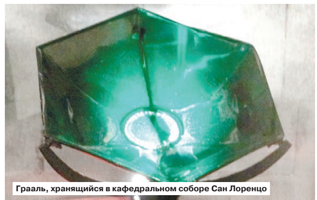
Грааль, хранящийся в кафедральном соборе Сан Лоренцо