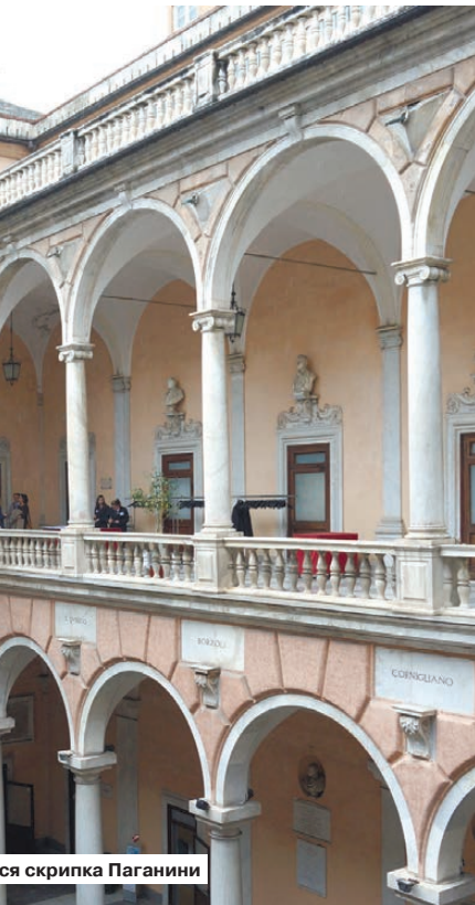
ся скрипка Паганини