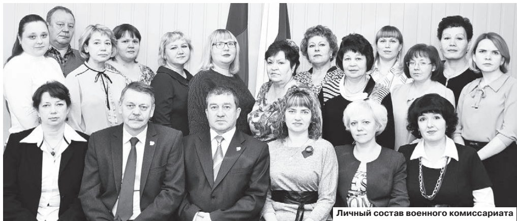
Личный состав военного комиссариата