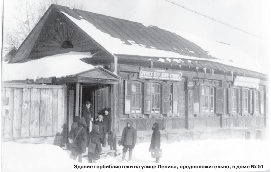
Здание горбиблиотеки на улице Ленина, предположительно, в доме № 51