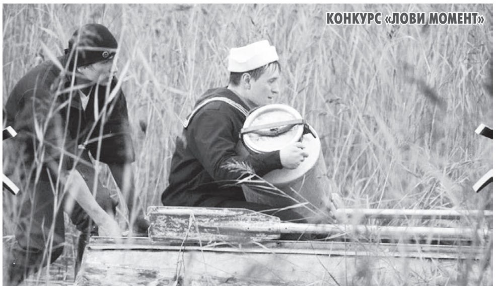
КОНКУРС «ЛОВИ МОМЕНТ»