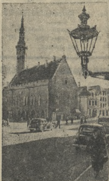
Ратушная площадь.

◆ Колхоз «Путь к коммунизму» 26 ноября закончил сдачу зерна и овощей государству.