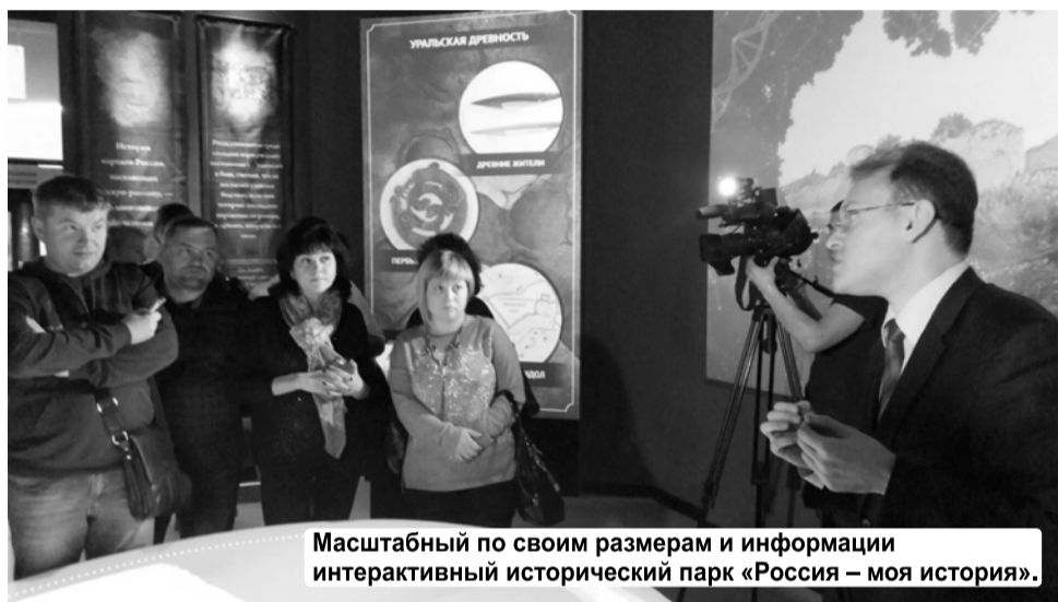
Масштабный по своим размерам и информации интерактивный исторический парк «Россия – моя история».

У парка, конечно же, есть официальный сайт - tuhistorypark.ru, где подробно дана необходимая информация. Кстати, на сайте так и говорится: «Создатели парка - а это историки, художники, кинематографисты, дизайнеры, специалисты по компьютерной графике - сделали всё, чтобы российская история перешла из категории чёрно-белого учебника в яркое, увлекательное и вместе с тем объективное повествование, чтобы каждый посетитель почувствовал сопричастность к событиям более чем тысячелетней истории своего Отечества. В историческом парке представлены все новейшие формы информационных носителей».