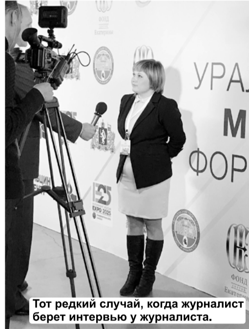
Тот редкий случай, когда журналист берет интервью у журналиста.

современным залам и ответит на все вопросы. Хочешь – просто иди и самостоятельно изучай материал на основе представленных данных на экранах, проекторах, интерактивных стендах.