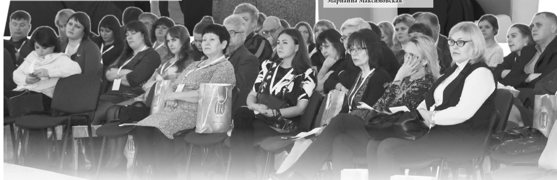
Под каким «соусом» лучше подать тему ЭКСПО-2025, как её разнообразить и сделать «вкусной» для аудитории, поделилась известная телеведущая Марианна Максимовская.