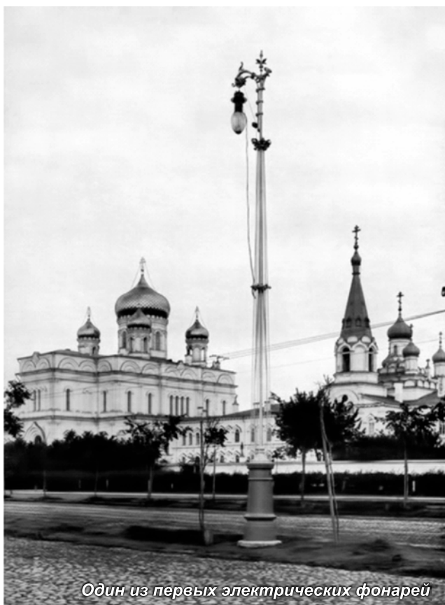
Один из первых электрических фонарей

В 1874 году русский электротехник А.Н. Лодыгин получил патент на изобретение лампы накаливания с угольным стерженьком и ежегодную Ломоносовскую премию Академии наук. Устройство было запатентовано также в Бельгии, Франции, Великобритании, Австро-Венгрии. В 1880 г. электрическая лампочка Лодыгина, усовершенствованная Т. Эдисоном, начала свое триумфальное шествие по планете.