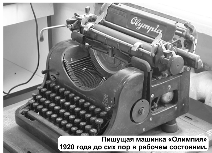
Пишущая машинка «Олимпия» 1920 года до сих пор в рабочем состоянии.