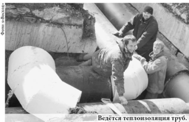
Ведётся теплоизоляция труб.

На главный вопрос «о парилке» специалист ответил, что свою работу они выполняют качественно и отвечают за неё стопроцентно. Проблема горожан решается, а это значит, что власти действуют в правильном направлении теплосбережения.