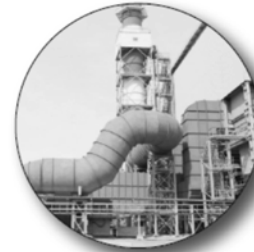
Сдан в эксплуатацию участок по производству глинозема на Уральском алюминиевом заводе