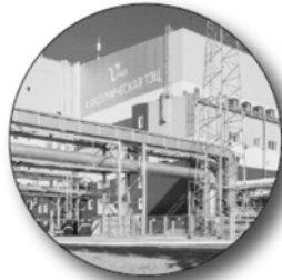
ТЭЦ «Академическая» в Екатеринбурге