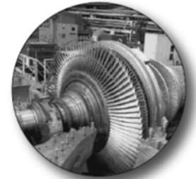
Парогазовая установка мощностью 420 МВт на Верхнетагильской ГРЭС

1 800 000 000 000 000 ₪ составили инвестиции в экономику Свердловской области в 2012-2016 годах