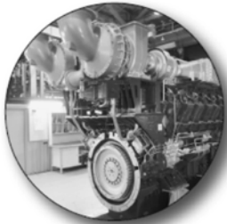
Введен в строй сборочный цех и комплекс по выпуску дизелей нового поколения на Уральском дизель-моторном заводе

За 5 лет в области возведено более 30 крупных промышленных объектов