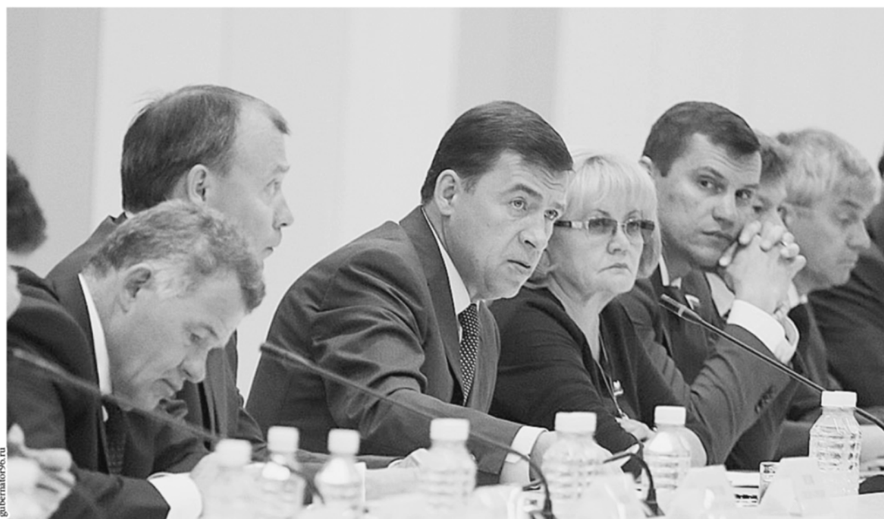
Глава региона Евгений Куйвашев (на фото в центре) на встрече с главами муниципалитетов.

Он поручил главам муниципалитетов довести до жителей информацию о личных приёмах граждан членами правительства, в том числе, с возможностью использования видеосвязи.