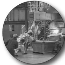
Новое производство на Екатеринбургском заводе по обработке цветных металлов