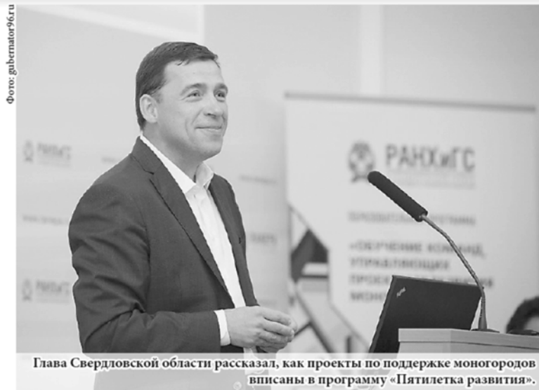
Глава Свердловской области рассказал, как проекты по поддержке моногородов вписаны в программу «Пятилетка развития».