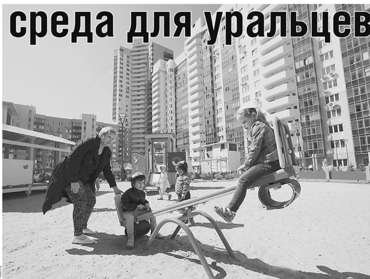
В муниципалитетах Свердловской области планируется реализовать свыше 100 программ комплексного благоустройства территорий.

● Проект рассчитан до 2021 года и будет осуществляться за счёт нескольких источников финансирования – областного, федерального и местного бюджетов, а в случае с благоустройством дворов – частичным участием средств собственников домов.