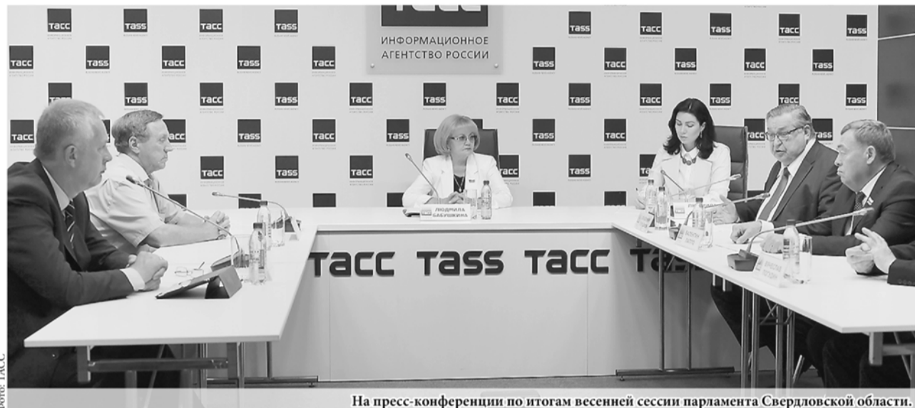
На пресс-конференции по итогам весенней сессии парламента Свердловской области.

Отметим, перерыв в заседаниях парламента не означает длительный отпуск депутатов: до 26 сентября будут проходить комиссии, депутатские слушания по законопроектам, которые планируются к рассмотрению в осенней сессии. Депутаты получают возможность больше работать в своих избирательных округах.