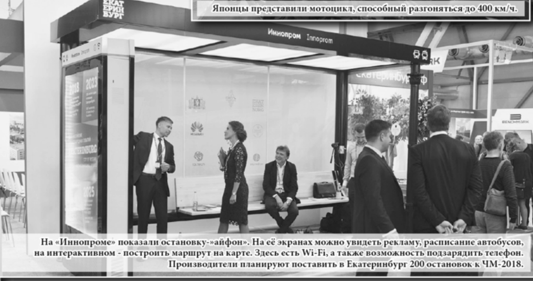
На «Иннопроме» показали остановку-«айфон». На её экранах можно увидеть рекламу, расписание автобусов, на интерактивном – построить маршрут на карте. Здесь есть Wi-Fi, а также возможность подзарядить телефон. Производители планируют поставить в Екатеринбург 200 остановок к ЧМ-2018.