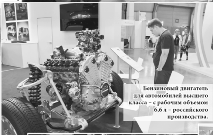
Бензиновый двигатель для автомобилей высшего класса – с рабочим объемом 6,6 л – российского производства.