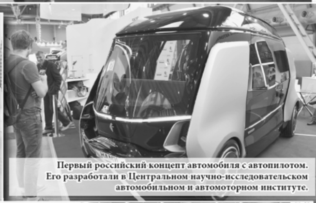
Первый российский концепт автомобиля с автопилотом. Его разработали в Центральном научно-исследовательском автомобильном и автомоторном институте.