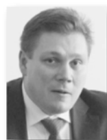
Вячеслав Тюменцев, замминистра природных ресурсов и экологии Свердловской области:

Список гидротехнических сооружений (ГТС), которые министерство природных ресурсов предложило для первоочередного ремонта, был рассмотрен депутатами муниципальных дум и Заксобрания региона.