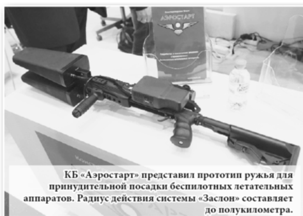
КБ «Аэростарт» представил прототип ружья для принудительной посадки беспилотных летательных аппаратов. Радиус действия системы «Заслон» составляет до полукилометра.