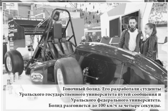
Гоночный болид. Его разработали студенты Уральского государственного университета путей сообщения и Уральского федерального университета. Болид разгоняется до 100 км/ч за четыре секунды.