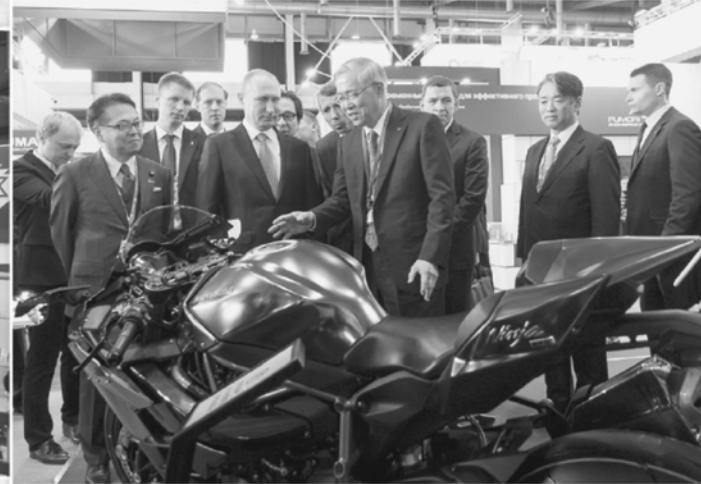
Японцы представили мотоцикл, способный разогнаться до 400 км/ч.