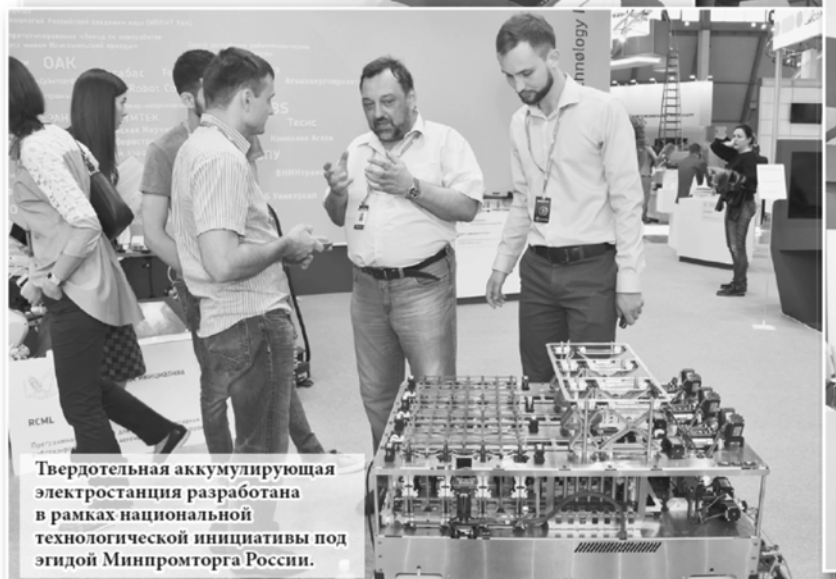
Твердотельная аккумулирующая электростанция разработана в рамках национальной технологической инициативы под эгидой Минпромторга России.