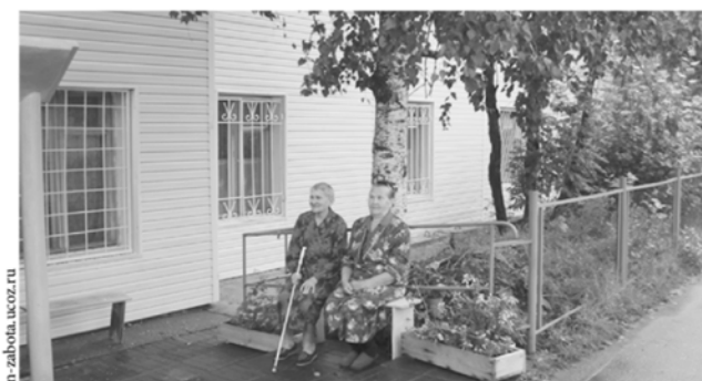
Центр помогает пенсионерам, инвалидам и людям в тяжёлой жизненной ситуации.