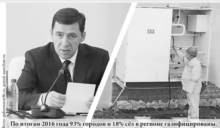
По итогам 2016 года 93% городов и 18% сёл в регионе газифицированы.

По поручению Евгения Куйвашева в Свердловской области будет расширен перечень получателей льгот на подключение жилых домов к сетям газоснабжения. Подготовку документов, предусматривающих соответствующие положения, министерство социальной политики региона завершит до 26 мая.