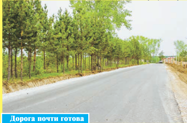
Дорога почти готова

В микрорайоне «Южный» продолжается строительство новых домов и ведутся работы по возведению полноценного микрорайона. Для застройщика важно, чтобы новоселы могли получить не только современную планировку и качественное жилье, но и обустроенную